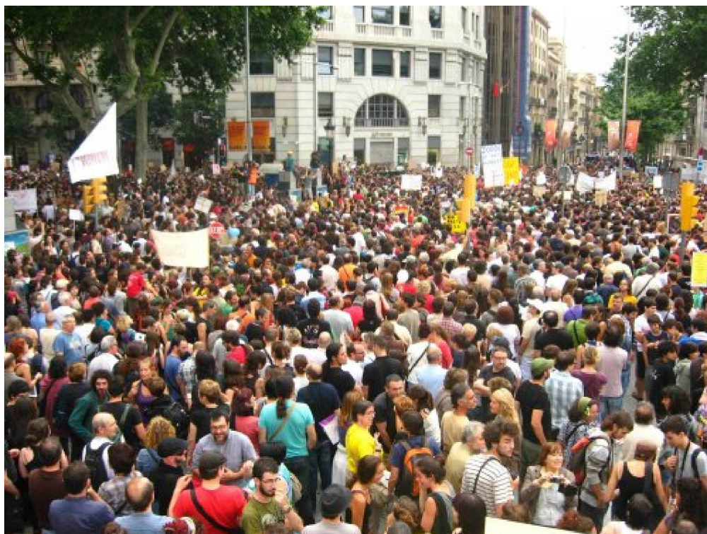
Photo : Barcelone 19

juin 2011