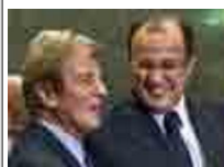
(Bernard kouchner et Taïeb Fassi Fihri)

Nous venons de tenir, dans un climat extrêmement chaleureux, le 7ème Conseil d'Association Union européenne-Maroc. Nous avons passé en revue de très nombreux sujets, hélas trop rapidement en raison d'un agenda chargé. Il y a en effet demain un Conseil des ministres et je dois intervenir à l'Assemblée nationale.