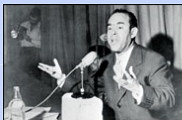
Un événement inédit dans les Annales du Parlement marocain : Une minute de silence à la mémoire de Mehdi Ben Barka

http://www.youtube.com/watch?v=DqOJPKuXAKQ&noredirect=1