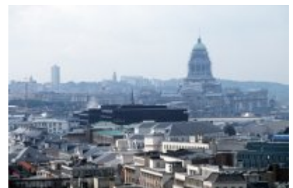
Alliance Habitat à Bruxelles 953 millions pour développer le