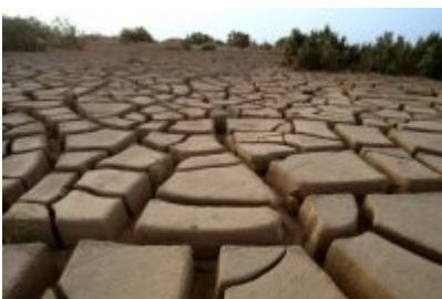
Climat La lutte contre le réchauffement