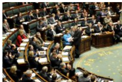
Indemnités parlementaires Tout le monde enfin d'accord avec