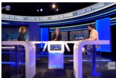
Emily Hoyos dans "Jeudi en prime" sur la RTBF