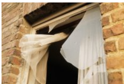
Manque de logements en Région wallonne