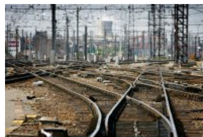
Révision du plan de transport de la SNCB