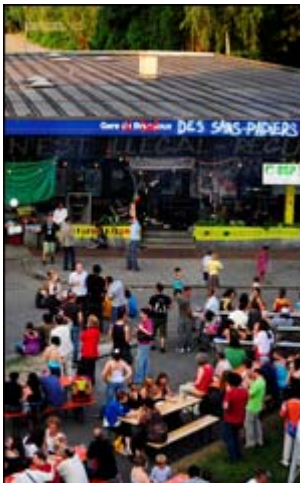
« Fête d'occupation de la gare de Bressoux », 4 juillet 2009.