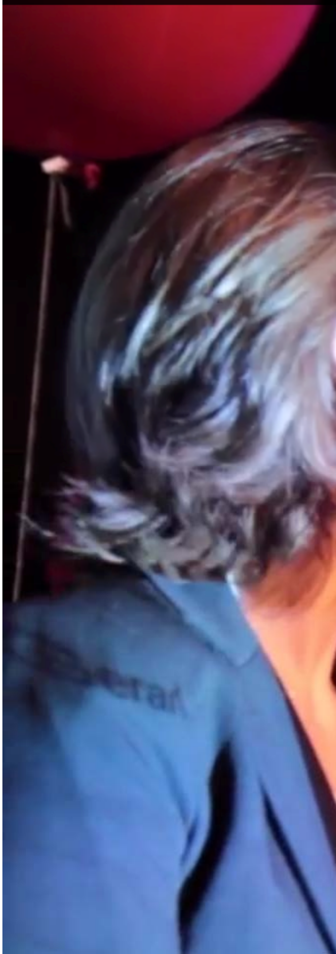
Michael Verbauwheide, tête de liste PTB*PVDA-gol, réagi