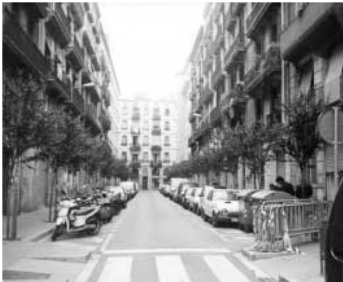
Barcelona - El Raval: Doctor Dou, nieuw gerenoveerde huizen en nieuw aangelegde straat

gebouwen opkopen om ze te verbouwen tot goed uitgeruste appartementen. De prijzen worden dan onbetaalbaar voor de oorspronkelijke bewoners (vaak ook voor de „pioniers” van de gentrificatie) en er doet zich een fenomeen van sociale verdringing of „gentrificatie” voor. (Delannoy, 2000, zie ook Beauregard 1986, Hannigan 1997, Knox 1986)