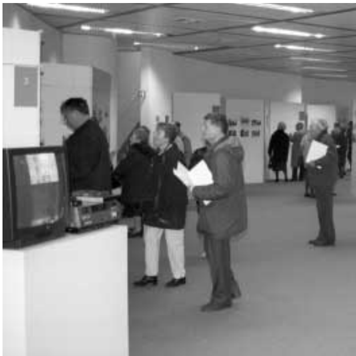
De expositie „van Kassei tot Noordwijk” met foto's uit het archief van Sylvain de Brabander.

Aan de ene kant zijn er het opbouwwerk en de buurtwerking, waar sedert enkele jaren een grote behoefte leeft aan historisch onderzoek om de eigen leefwereld beter te doorgronden. Deze belangstelling is deels te verklaren uit de belangrijke transformaties die de buurt onderging in de tweede helft van de 20ste eeuw. Vragende – en