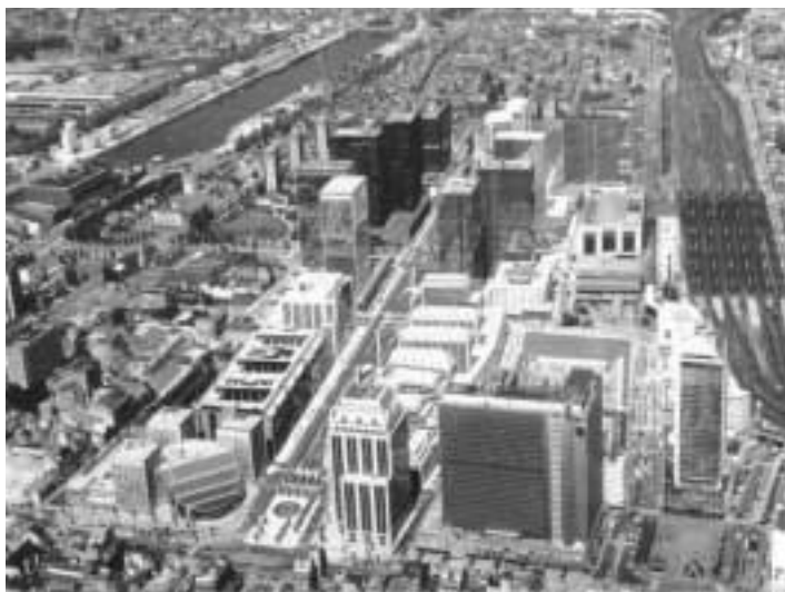
Simulatie van geplande hoogbouw langs de Koning Albert II-laan in de Noordwijk.

Dit project zal binnen afzienbare tijd een vervolg krijgen in een tweeluik: een praktijkgericht buurt-project met een sterke historische component (De grote en kleine historie van de Kassei) en een theoretisch en methodologisch onderbouwd project vanuit de opdrachten en streefdoelen van een wetenschappelijke instelling (Clio in de Kassei).