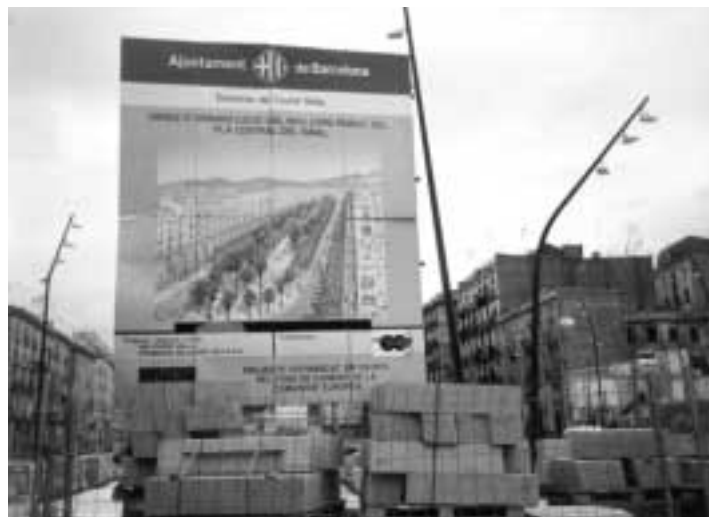
Barcelona - El Raval: New Rambla, aanleg van een nieuwe rambla en het neerhalen van oude bestaande woningen.