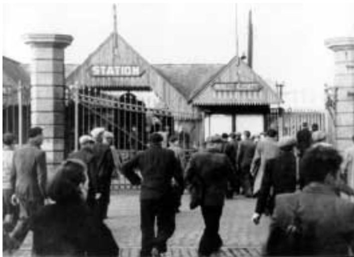
Pendelaars, toen via het treinstation van de Groendreef, nu via het Noordstation.

Een tweede, daarmee verband houdende optie is het doornemen van de internationale literatuur over