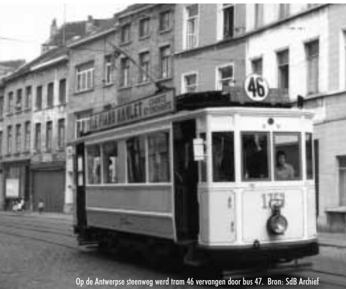
Op de Antwerpse steenweg werd tram 46 vervangen door bus 47.

contacten met telkens specifieke en waardevolle verhalen en foto's en een groep die „verder” wou gaan ... een nieuwe tentoonstelling, een boek ... Er werd gestart met het „stamineeproet”-initiatief, maandelijks vertelnamiddagen waaruit een stilaan indrukwekkend arsenaal aan getuigenissen voortspuit. Verder is er de enorme collectie van voorwerpen en meer dan 2000 foto's over de veranderingen in de wijk van Sylvain de Brabander. Deze prachtige te ordenen en sterk uit te breiden collectie smeekt om bewerking, om een publicatie en een synthese.