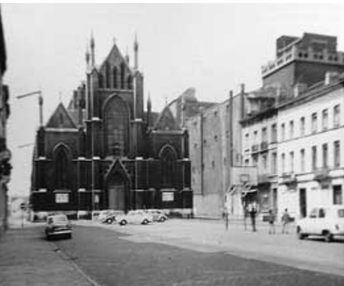
Basketbalspel op het toenmalige Sint-Rochusvoorplein.

Niet alleen de reconstructie van de Kassei in verhalen en foto's heeft een belangrijke signaalfunctie naar de Brusselse en Belgische stadsdynamiek. Ook het feit dat dit project van bij de oorsprong door bewoners wordt gedragen lijkt ons een uniek gegeven. Het wordt hun grote en kleine historie.