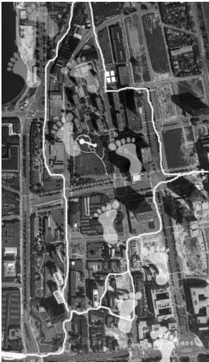
De witte lijn en voetafdrukken op de luchtfoto verbeelden het parcours „Ratten en Muizen”.

Het ligt in de lijn van het voorgaande dat de con-