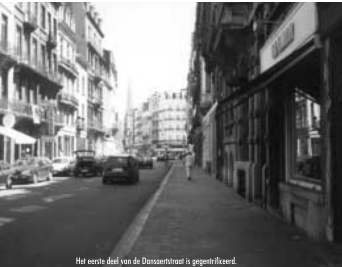
Het eerste deel van de Dansaertstraat is gegentrificeerd.

Het is een interdisciplinaire studie die zich toelegt op de sociale, economische, architecturale- en culturele effecten van de Europese stad op haar inwoners en gebruikers.