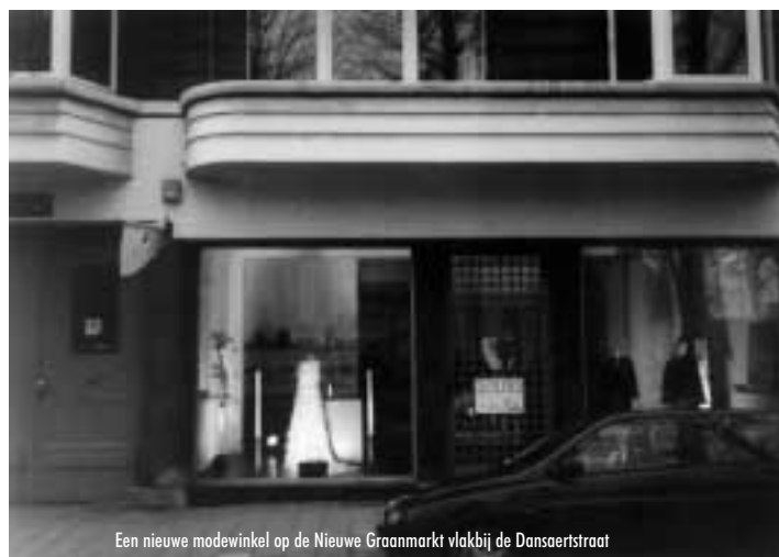
Een nieuwe modewinkel op de Nieuwe Graanmarkt vlakbij de Dansaertstraat