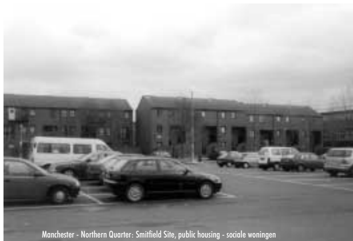
Manchester - Northern Quarter: Smitfield Site, public housing - sociale woningen

De lokale overheid en privé-ondernemers komen tussen in het herwaarderingsproces. Het besef van de stijgende vraag naar huisvesting in gerenoveerd oud architecturaal patrimonium in het stadscentrum waar een nieuwe culturele identiteit gecreëerd is, brengt een interventie van de overheid en privé-investeerders met zich mee. Hun objectief is om de invasie van nieuwe inwoners te stimuleren hetgeen verdergaande renovatie brengt in deze vervallen buurten.