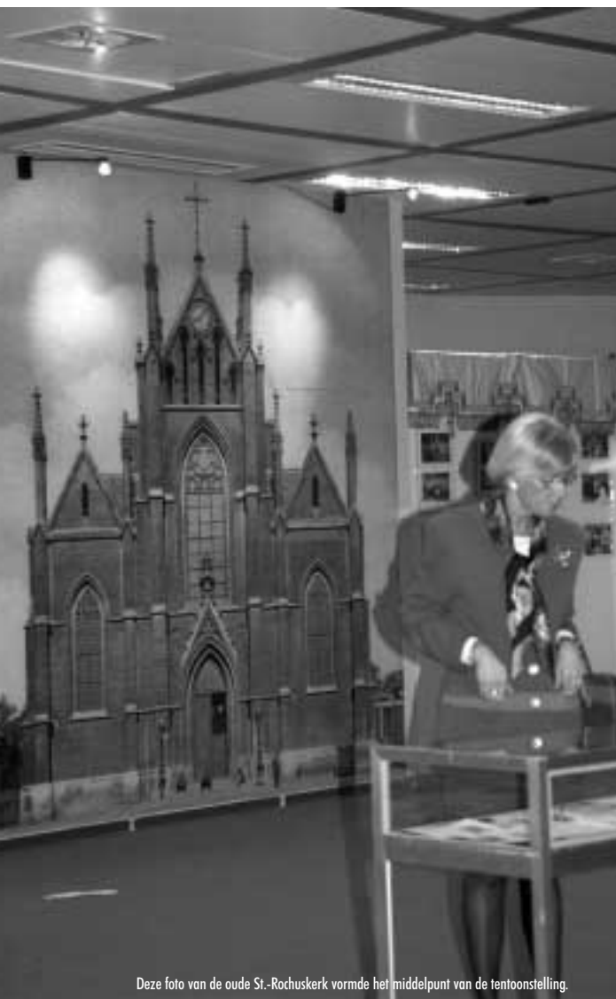
Deze foto van de oude St.-Rochuskerk vormde het middelpunt van de tentoonstelling.

Vooreerst zal het gezamenlijk werken aan een buurtgeschiedenis belangrijke effecten sorteren in de Noordwijk zelf. Door samen te werken aan een gemeenschappelijk project dat in dialoog met verschillende partners tot stand komt, verhoogt de hoeveelheid sociaal kapitaal in de buurt. Tegelijkertijd wordt een sociale identiteit van de buurt gecultiveerd. Met name in een woonwijk die door de projecten van bouwpromotoren en door de aanwezigheid van vele kantoren al zwaar op de proef werd gesteld is dit cruciaal. Het realiseren van een boek, een cd-rom en tentoonstelling maakt het mogelijk collectief naar buiten te komen en zich te tonen aan de buitenwereld.