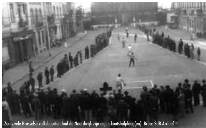
Zoals vele Brusselse volksbuurten had de Noordwijk zijn eigen kaatsbalploeg(en).

De foto's bij dit artikel met de bronvermelding SdB Archief komen uit het fotoarchief van Sylvain de Brabander.