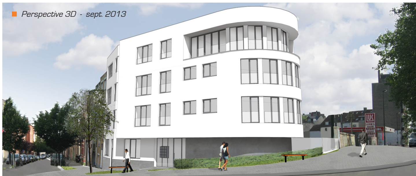
■ Perspective 3D - sept. 2013

Ce concours, au-delà d'une reconnaissance évidente, offre un subside exceptionnel de 100 € / m² et un soutien technique tout au long du projet pour épauler l'équipe d'architectes.