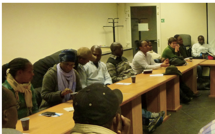
■ Réunion préparatoire du nouveau GECS