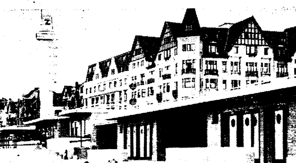
MODERNE BADHUISJES OP HET STRAND VAN DE ZOUTE

Naar het voorbeeld van Oostende, het thans De Zoute nieuwe vaste badhuisjes bouwen, in den zedijk aangebracht. Ook in deze Noordelijke badplaats werden dus de verouderde rollende houten badhuisjes voor goed op stal gezet.