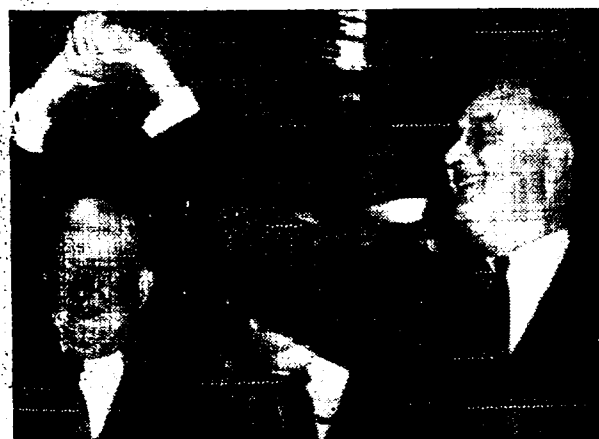
ROOSEVELT KANDIDAAT DER AMERIKAANSCH DEMOKRATEN