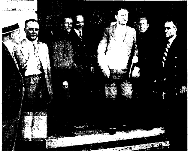
Leon Blum en Yvon Delbos (links, achteraan), gekiekt op het oogenblik, dat ze hun Geneefsch hotel verlaten om zich naar den Volkenbondsraad te begeven.