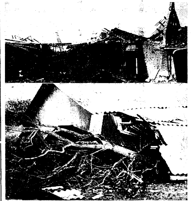
DE ORCAAN TE MOESKROEN Ziehier een paar kiekjes van de groote vreesoestingen, door den orkaan, maandagvoormiddag te Moeskroen en omstreken aangericht. Boven: een vernielde pachthoeve. Onderaan: boomen en schuren, door den wind neergesmeten.

De Eekloosche bleekuitvoerder, die met zijn handsteek uit de wijk Raveschoot, stond, vluchtte in een woning en toen hij later buiten kwam, stelde hij vast dat zijn kar verdwenen was: hij vond ze een dertig meter verder, verbrijzeld in een gracht.