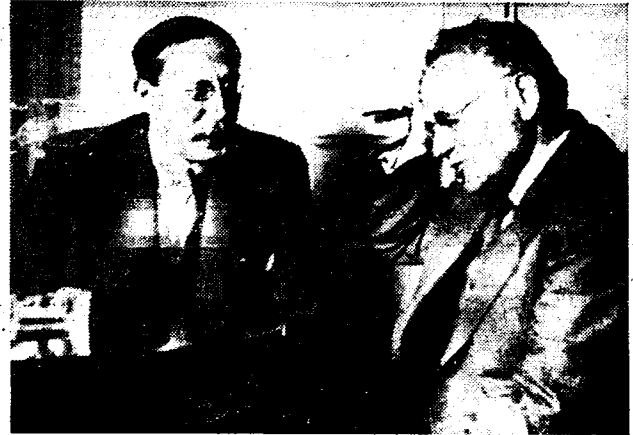
Leon Blum heeft te Genève, enkele uren voor de opening van de Volkenbondsvergadering, een lang gesprek gehad met Litvinof, de afgevaardigde van de Sovjet-Unie.