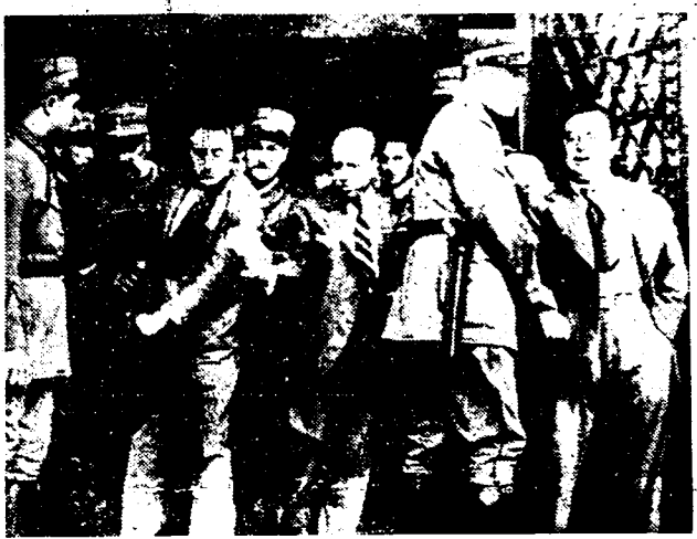
Hierboven een treffende opname tijdens de relletjes te Genève, waarbij enkele ruststoorders als manifesteerden tegen de aanwezigheid van den negus werden aangehouden.

De vliegtuig naar Londen terug te brengen. Het vliegtuig, dat Mollison uit aanbod heeft aanvaard en slechts op bericht wacht, wanneer de keizer wil vertrekken en hoeveel personen met het vliegtuig mee moeten.