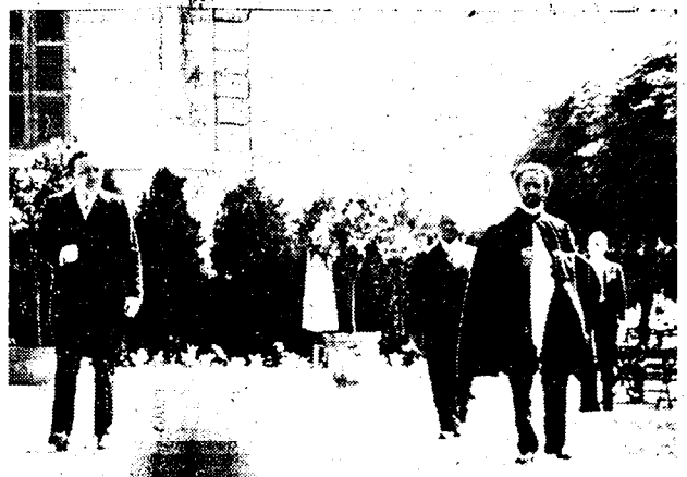
Zooda men weet vertoefde de negus thans te Genève, waar hij een laatste kans waagt om recht voor hem en zijn volk te verkrijgen. Men ziet hem hier op het terras van zijn hotel, omringd door journalisten en kineasten.

Vernomen wordt, dat de keizer van Abessinië voornemens is per vliegtuig uit Genève naar Londen terug te keeren. Het vliegtuig zal worden bestuurd door den bekenden vlieger Jim Mollison. De vertegenwoordigers van den keizer hebben Mollison gevraagd of hij bereid is naar Genève te vliegen om den keizer en zijn gevolg