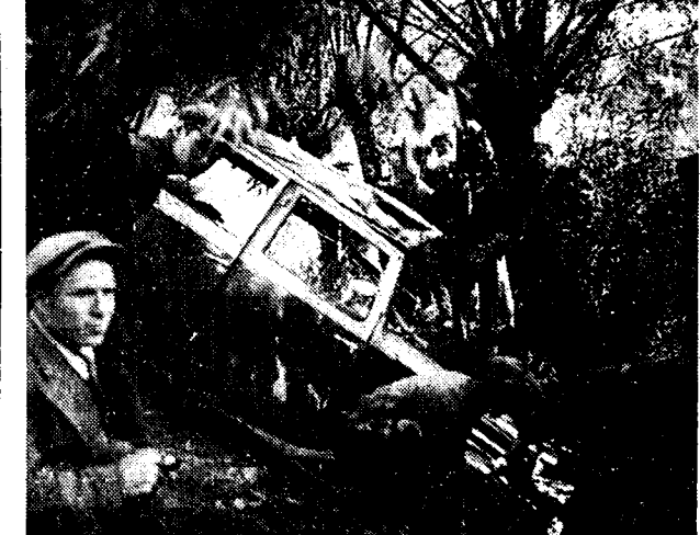
De Engelsche auto, die gisteren te Latem op de Kortrijksche baan veronglukte.

Gistermorgen, rond 9.15 uur gebeur- de er eens te meer een vreeselijk auto- ongeluk op de baan Gent-Kortrijk, ter hoogte van Latem aan de herberg «Hoog Laethem».