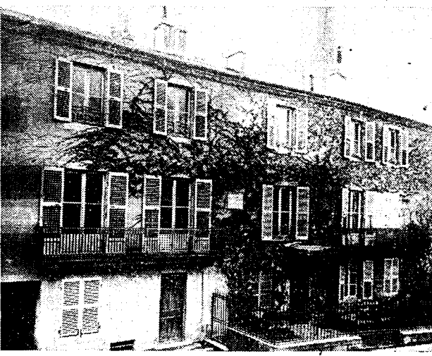
HET HUIS VAN PASTEUR

Menelik is een zoon van Lieds Jaso- soe, die kortgeleden in gevangenschap is gestorven.