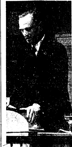
DE STEM VAN ZUID-AFRIKA

Lux is gehuwd: Zijna vrouw en kind verblijven te Praag.