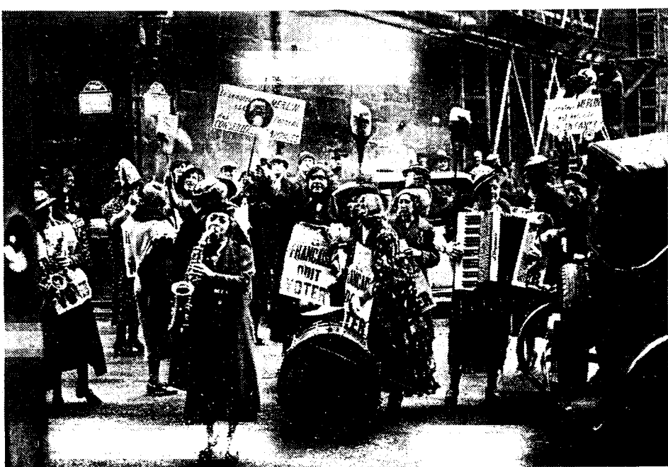
Een Parijsch raadslid, die zich tegen de benoeming van vrouwelijke raadsliden in den Gemeentelijken Raad van Parijs had verzet, kreeg vanwege een groep muzikale suffragettes een nachtelijke serenade

Het geboortehuis van wijlen den beroemden Franschen geleerde Pasteur, in het Fransche stadje Arbois, wordt thans als museum ingericht waar talrijke herinneringen aan het wetenschappelijk leven van Pasteur zullen verzameld worden.