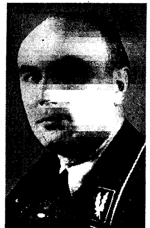
DE H. GREISER

De nationaal-socialistische voorzitter van den Danziger-senaat, die zich door zijn grove tusschenkomst op de Volkenbondsvergadering onderscheidde.