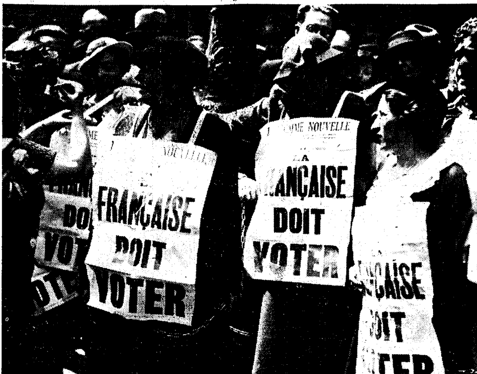
Het schijnt de Franche sufragetten thans zwaren ernst te zijn; met haar beweging tot het bekomen van kiesrecht voor de vrouwen. De manifestaties in de straten van Parijs vermenigvuldigen zich elken dag en worden steeds meer woelige.