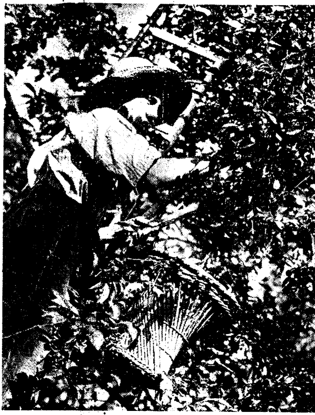
Een mooi seizoenbeeld: de kersenplukker in den kersenboom.