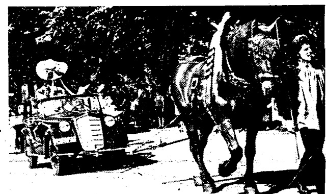
TEGEN DE AUTO-TAKSEN

Al de automobilisten van Zwitserland zijn in staking gegaan, uit protest tegen te hooge auto-taksen. In verschillende Zwitsersche steden grepen te dezer gelegenheid eigenaardige manifestaties plaats.