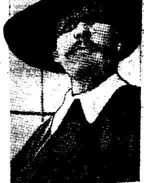
Charles Laughton als Rembrandt

«Mijn opvatting van Rembrandt» zegt hij. «Vraag acht, negen uur per dag. Ik kom 's avonds doornuut. Wat weet ik er van, hoe weet ik of het goed zal zijn? Misschien is het wel zoo dat je op mij zou willen schieten als je de film niet