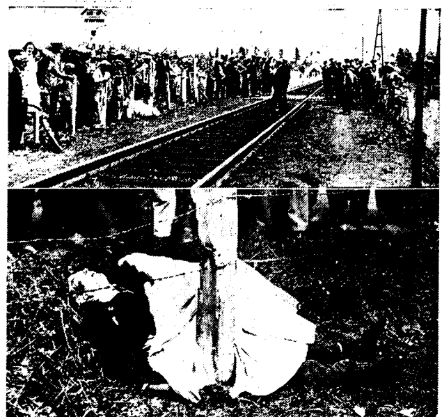
Boven: de plaats waar het ongeluk gebeurde. — Onder: het verminkte lijk van het slachtoffer.

De reizigers, die Maandag plaats namen in de treinbus, dat te 11.30 u. uit Lokeren naar Gent vertrekt, werden op de hoogte van den onbewaakte overweg, nr. 56, juist voor Staakte, opgeschrikt door een hevigen slag en het plots haastig remmen van het treintje.