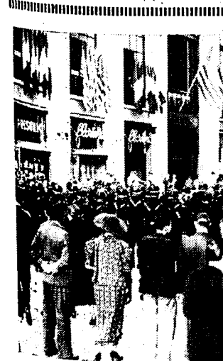
DE CHAMPS-ELYSEES ONDER SPECIALE BEWAKING Tegenwoordig van de relikes op de Parijsche avenue des Champs Elysees door nationaalistische woelmakers vernietigd, worden thans zware gebouwen, tegen dewelke men tegenmanifestaties vreesd, door de garde mobile bewaakt.