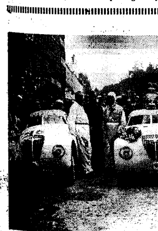
TE FRANCORCHAMPS Op den 24. uren-koers te Francorchamps werd de schaal van den koning gewonnen door deze ploeg, saamgesteld uit drie Adler-auto's.

Het kongres besluit per telegram bij de Statenbond aan te dringen opdat deze zijn belofte zou houden tegenover den Vrijstaat Dantzig, en de democratische bevolking van deze laatste zou beschermen tegen de naziterror. Tot besluit van het verslag van Cornelis Mertens over de sociale politiek en de plannen tot bestrijding van de kries, neemt het kongres een resolutie aan waarbij wordt besloten spoedig een