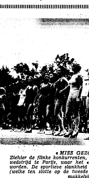
„MISS GEZONDHEID 1936“ Ziehier de flinke konkurrenten, die 1. Zondag deelnamen aan een wedstrijd te Parijs, waar 't „gezondste“ meisje moest verkozen worden. De sportieve slankheid der modellen zal de keus der jury (welke ten slotte op de tweede van links is gevallen) niet vergemakkelijkt hebben.

Tijdens de autowedstrijden te Sao-Paulo slopte de auto van de deelnemster Heile-Nice, en kwam in de toeschouwers terecht, na drie buitelingen om zichzelf gedaan te hebben. Vijf personen werden gedood.