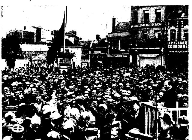
KONING ALBERT-STANDBEELD TE ST-QUENTIN

Zie verder op onze sportpagina de volledige uitslagen en onze beschouwingen over den rit.