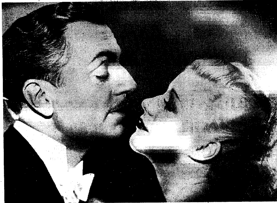
GINGER ROGERS en WILLIAM POWELL, in de film «Mr. Sherlock en Mev. Holmes».