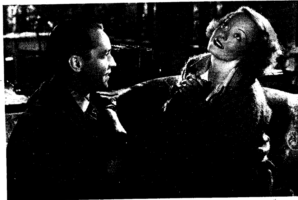
BETTE DAVIS en FRANCHOT TONE, in de film «Een gevaarlijke vrouw».