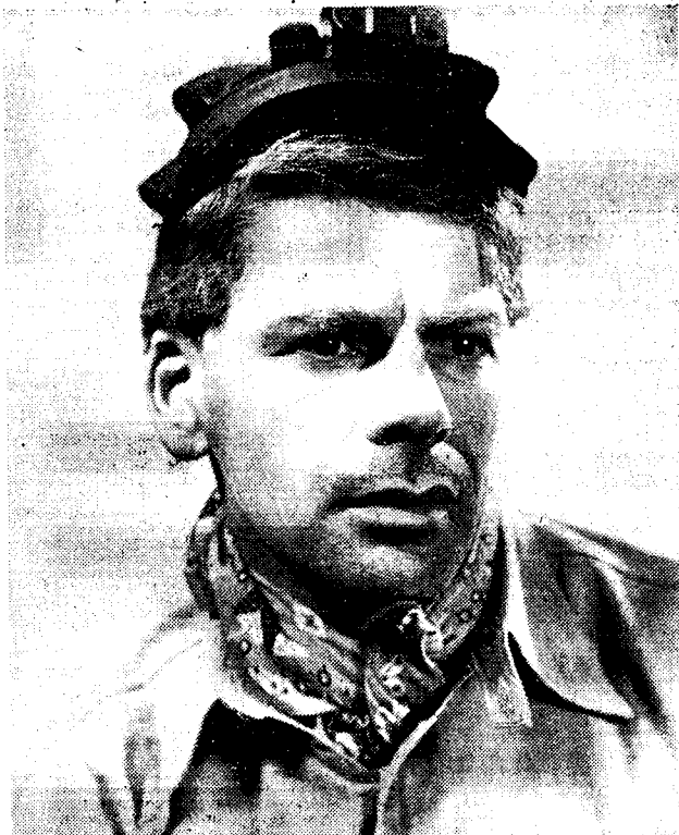
PAUL MUNI, in de film «Zwarte furie».

Er wordt steeds weer geklaagd over de verspillen, waaraan Hollywood zich geregeld bezondigt. De klagers kunnen het nu weer hebben over wat er bij het maken van de film Anthony Adverse, gebeurd is. Om van dit overdadige boek een film te maken, was 725.000 voet filmband noodig. Er moesten 131 verschillende dekors worden vervaardigd. In de film treden niet minder dan acht-en-negentig personen in min of meer belangrijke rollen op. In Reinhardt's «A Midsummer Night's Dream», waaraan ook zooveel filmband ten koste is gelegd en die eveneens schattingen heeft gekost, waren slechts tweeëntwintig rollen. Er treden 2500 figuren in op, die in totaal 3721 kostuums noodig hadden. Alvorens aan de film te beginnen, heeft regisseur Mervyn Le Roy het boek zes maal doorgelezen. En het heeft maar weinig gescheeld, of men had op het laatste ogenblik nog een ander als regisseur aangewezen.