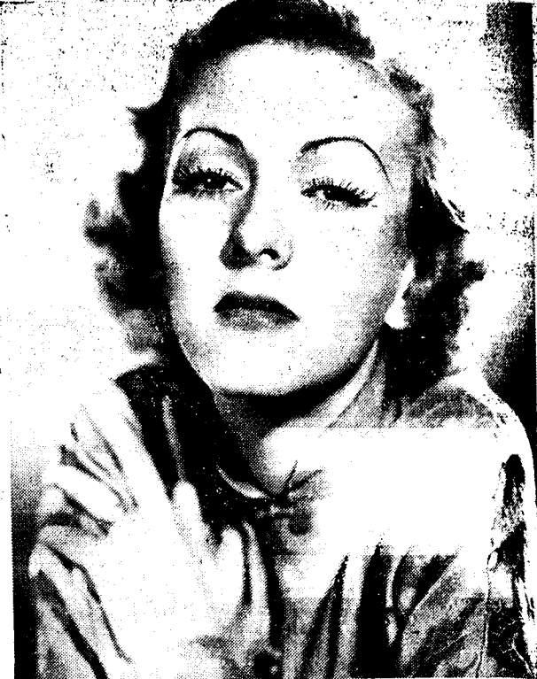
KAREN MORLEY, in de film «Zwarte furie».