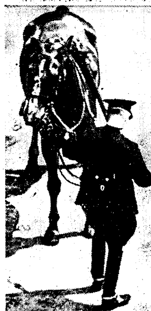
De koning van Engeland stapte kalm van zijn paard na den mislukten aanslag.

« Ik wilde niet doodden, maar protesteeren tegen de doodstraf », verklaarde hij