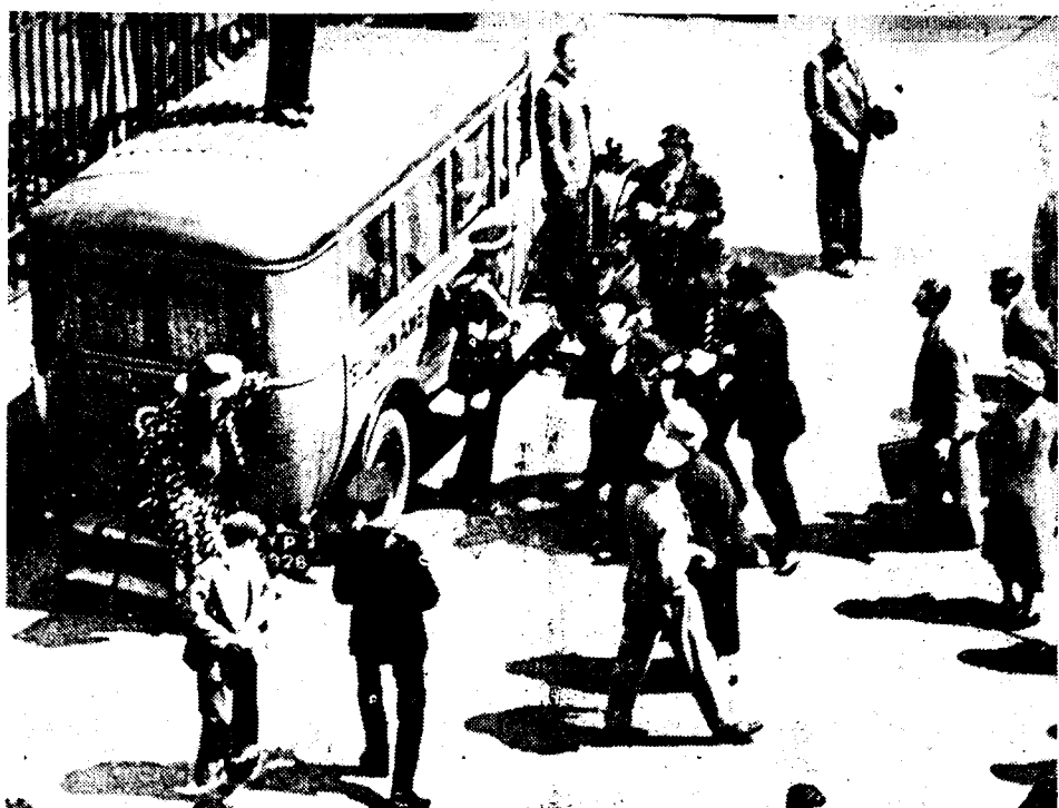
Een andere jaze van de aarhouding van den man, die den aanslag op den koning van Engeland pleegde.