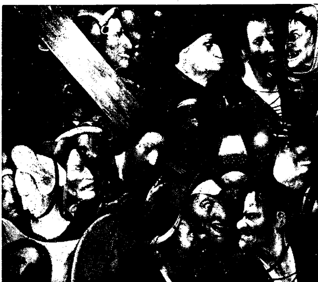
JEROEN BOSCH: DE KRUISDRAGING. Dit prachtig paneel, een der meest authentieke meesterwerken van Bosch, is in bezit van het Museum voor Schoone Kunsten te Gent. Het ontbrak op de Rotterdamse tentoonstelling.

Over zijn leven en zijn werken zijn bijna geen bepaalde data voorhanden. We weten alleen, dat hij in 1516 te 's-Hertogenbosch overleed, waar hij schuilnaam «Bosch» ontdekte hij trouwens aan deze stad, terwijl zijn eigenlijke naam, Jeronimus van Aken, er veeleer zou op wijzen, dat zijn voorouders uit Aken afkomstig waren. Voor zijn geboorte