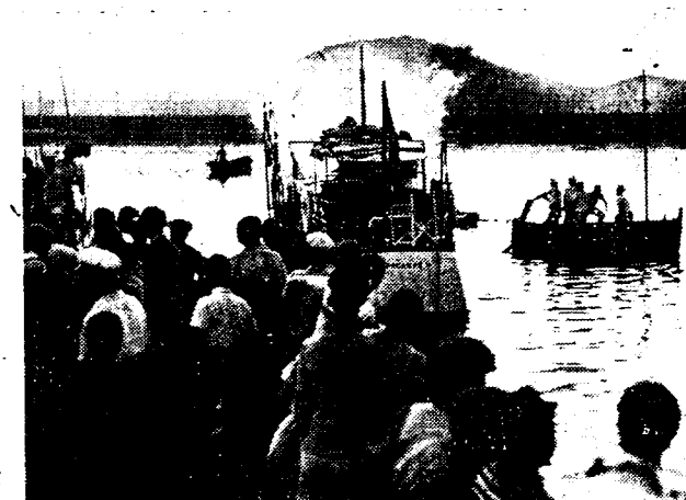
JACHT IN BRAND BIJ SAINT-TROPEZ

Ziehier in de baai van Saint-Tropez het brandende speeljacht «Hippocampe», dat zoals we meldten, brandende naar zee werd gesleept en daardoor een Fransche onderscheider met granaatschoten tot zinken werd gebracht. Niet zonder dat enige granaten op het stadje Saint-Maxime terecht kwamen en daar nogal wat paniek teweegbrachten.