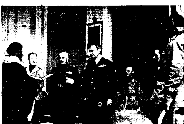
HET FASCISTISCH BESCHAVINGSWERK IN ABESSINIE

Aan de regeringen van Cuba, Jamaica en Mexico is verzocht te helpen zoeken en 4 regeringsvaartuigen zijn reeds urenlang onderweg geweest in den Golf van Mexico, maar hebben geen spoor van het schip gezien.