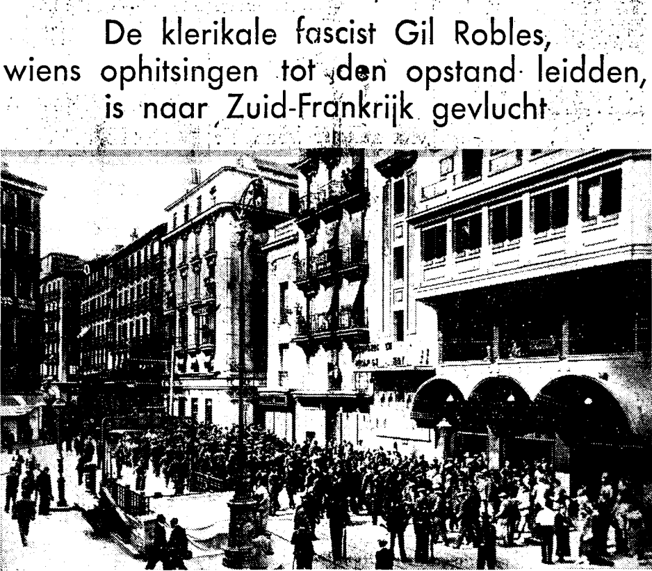
Een straat in het centrum van Madrid, waar met spanning de berichten over den toestand worden besproken

De klerikale fascist Gil Robles, wiens ophitsingen tot den opstand leidden, is naar Zuid-Frankrijk gevlucht