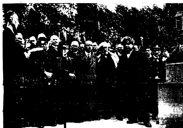
VERHAEREN-HERDENKING TE SINT-AMAND-PUERS