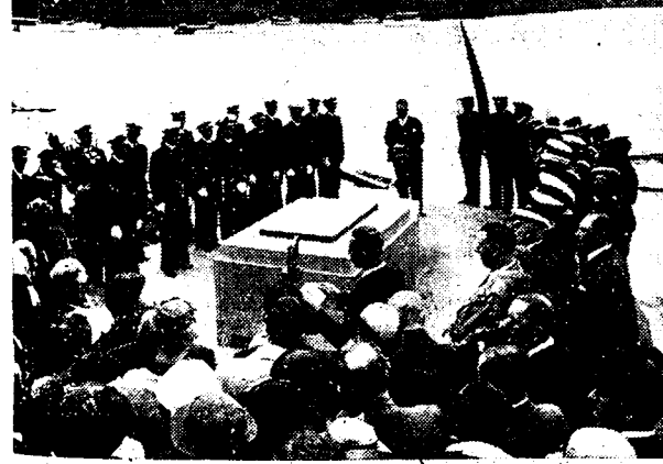
VERHAEREN-HERDENKING TE SINT-AMAND-PUERS