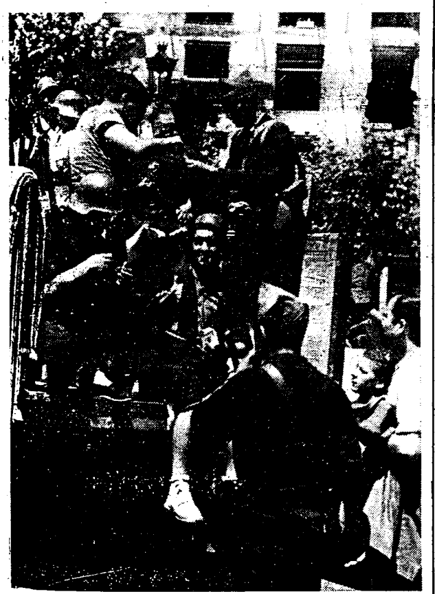
Steeds meer kamions vertrekken uit Madrid, volgeladen met arbeiders-militanten, thans volledig geoesend en voor den strijd uiterst.