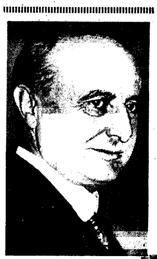
LOUIS BLÉRIOT. Zoolals we gisteren meldten, is Louis Blériot, de destijds bejaamde vlieger, die in 1909 voor het eerst over het Kanaal vloog, in den ouderdom van 64 jaar overleden. Bovenstaande foto werd enkele weken geleden gemaakt.