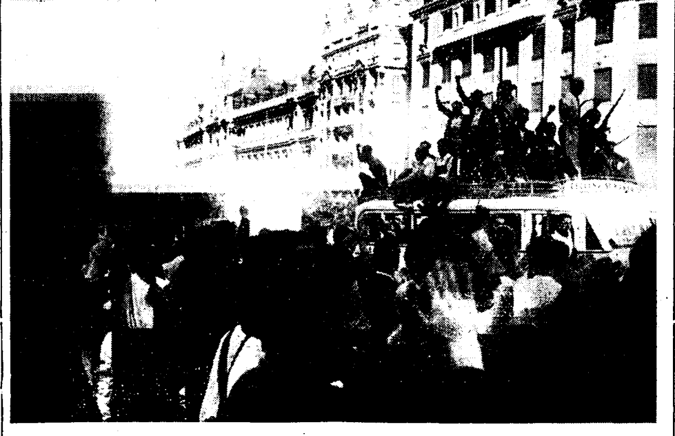
Elken dag komen te Madrid talrijke arbeiders-militanten aan uit de zuidelijke provincies, die dienst komen nemen in de geleerden ter verdediging van de republiek. Zij worden, zoolals men ziet, geestdriftig door de Madrileense bevolking begroet.