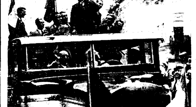
Ook te Brussel viel de rondemannen een geestdriftig onthaal ten deel. Onze foto toont de auto-car, waarmee de overwinnaars van de Ronde van Frankrijk, met Sylveer Maes voorop, van het Zuidstation naar het stadhuis werden gevoerd. De tocht ging langs een sympathieke menigte. En op het Brusselsch stadhuis was de ontvangst zeer hartelijk.

De Italianen oefenen een waar schrikbewind uit