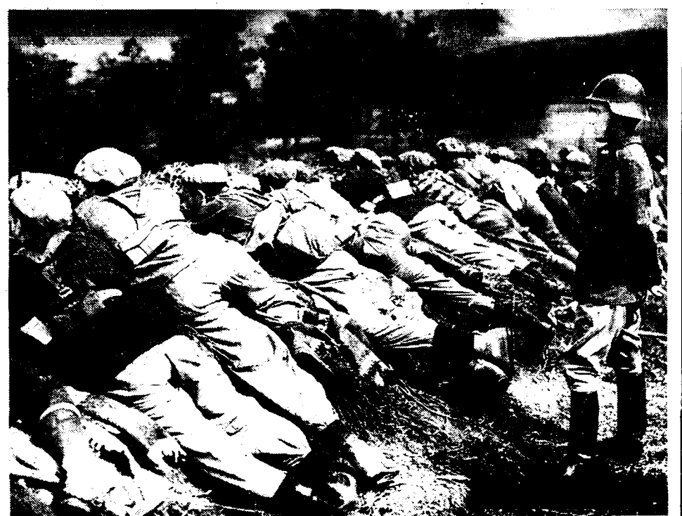
Carlistische vrijwilligers, met het bekende roode baret op het hoofd, hebben de partij gekozen der fascistische opstandelingen. Ingelijfd bij de troepen van generaal Mola, krijgen zij onderricht van een onderofficier der rebellen.