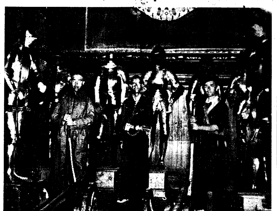
Te Madrid is het historisch paleis van den hertog Medinaceli, als verblijfplaats voor een afdeling arbeiders-militanten ingericht. In de wapenzaal van het paleis, geeft dit aanleiding tot het zonerling samentreffen van oude harnassen, symbool der feodaliteit, en jonge voor hun vrijheid vechtende vertegenwoordigers van het proletariaat.

De Russische arbeiders brengen 150 miljoen frank saam voor het Spaansche Volksfront