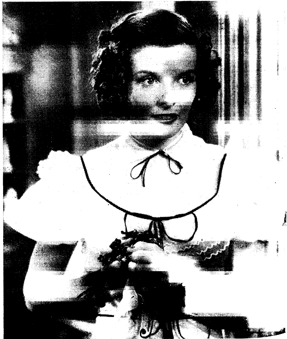
KATHARINE HEPBURN in de rol van Alice Adams in de film «Geheim Verlangen»