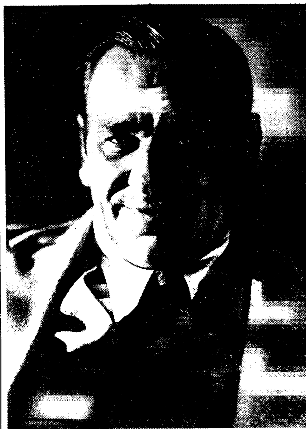
EEN MOOI PORTRET VAN WALLACE BEERY.

Een pracht karakter-speler. Was in zijn jeugd oppasser bij de olifanten in het Ringling Brothers Circus, daarom noemt men hem nog «elefant's nursemaid». Heeft in een ontzaglijk aantal films gespeeld; vormde met de overleden Mary Dressler een schitterend duo op het witte doek. Zijn rollen karakteriseeren meestal een mensch die handelt naar zijn instinktieven aard; soms wreed, dan ook weer goed- hartig. Als mensch een doodeenvoudige, gemoedelijke kerel; voelt zich absoluut geen wereld-beroemde film-held.