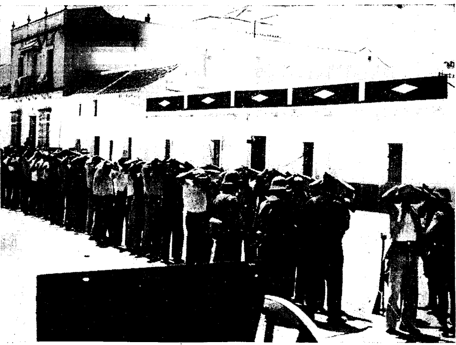
Bij de terugname van Sevilla door de regeringstroepen, vielen een groot aantal rebellen in handen der overwinnaars. Men ziet ze hier ontvoerd en na ondervraging naar de gevangenis gebracht worden.