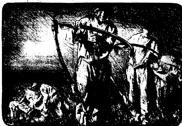
FRANK BRANGWYN: Maaiers aan het werk (Lithographie, Brangwyn-museum te Brugge)

(+) Collection «Socialisme et Culture», Edition Sociales Internationales, Paris.