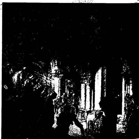
FRANK BRANGWYN: Pelgrims en bedelaars (Ets op zink, Brangwyn-museum te Brugge)