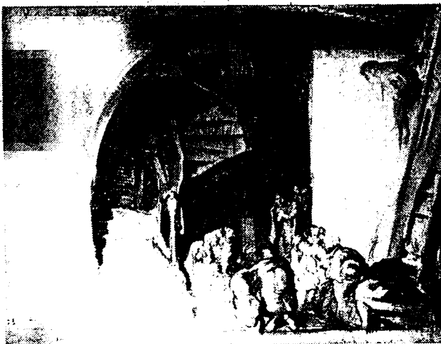
FRANK BRANGWYN: De Geboorte. Getekende en gelaveerde studie voor de meesterlijke ets op zink uit het jaar 1912 (De ets is in het Brangwyn-museum)