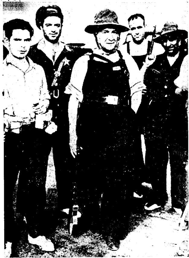
De socialistische leider en volksafgevaardigde Largo Caballero bevindt zich met de arbeidersmilities op het Sierra-front bij Guadarrama.