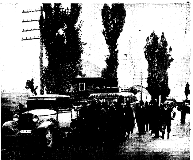
Een afdeling mitralleurs behoorend tot de rebellen-troepen op een weg ten noorden van Madrid, in de streek van Guadarrama.

De oorzaken van het vliegongeluk zijn nog niet gekend.