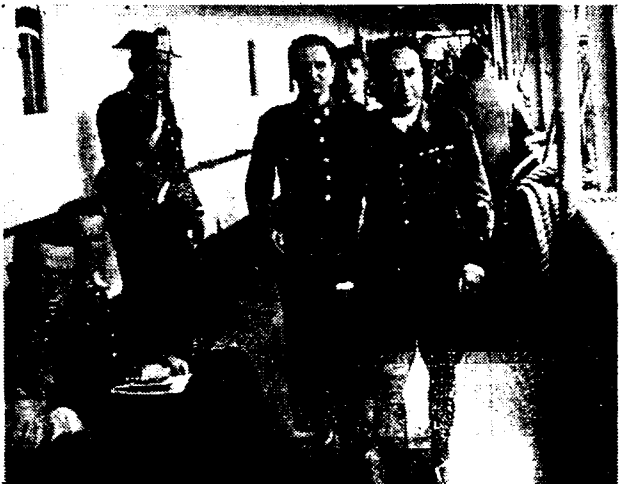
Rebellen-officieren in gevangenschap aan boord van de «Uruguay».