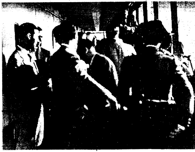
De deelnemers aan het proces tegen de rebellen-generaal Goded en Burriel, werden bij hun aankomst op de «Uruguay» en doorens in de gerechtszaal toegelaten te worden, zorgvuldig afgepast.