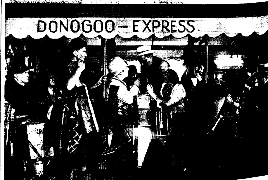
Toneel uit «Donogoo».