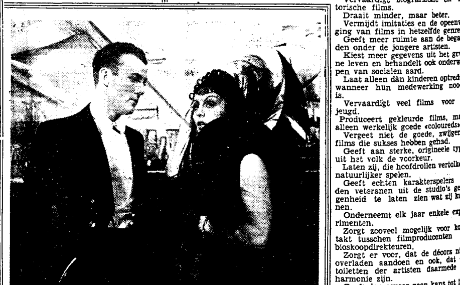
Renée St. Cyr en Raymond Rouleau in de film «Donogoo».

Een nog romanesker film heet «De Bespijster Elza», welke verhaal van een Oostenrijksche danseres die te Londen verblijft kort voor den oorlog, waar zij verliefd werd op een bekend akteur, die ingevolge het uitbreken van den oorlog genoodzaakt wordt het Engelse leger te vervolgen, terwijl de danseres als lid van de Oostenrijksche geheimpolitie met een Duitsche opdracht wordt belast. Zij verlaat ongemerkt haar vriend, die zich uit verblinding laat inlijven bij de «Intelligence Service». Dientengevolge laat hij zich gruwelijke gene maken en wordt naar de Duitse wapenfabrieken gezonden, van waaruit hij nuttige inlichtingen kan verstrekken aan den Engelsen leger. De Duitschers vermoeden dat geheime inlichtingen worden overgeseind en sturen er de danseres op af. Het laat zich begrijpen dat de danseres haar Engelsch akteur in het nauw drijft en dat de liefde ten slotte overwint, na talloze dramatische ontwikkelingen, waarvan de ene al onwaarschijnlijker is dan de