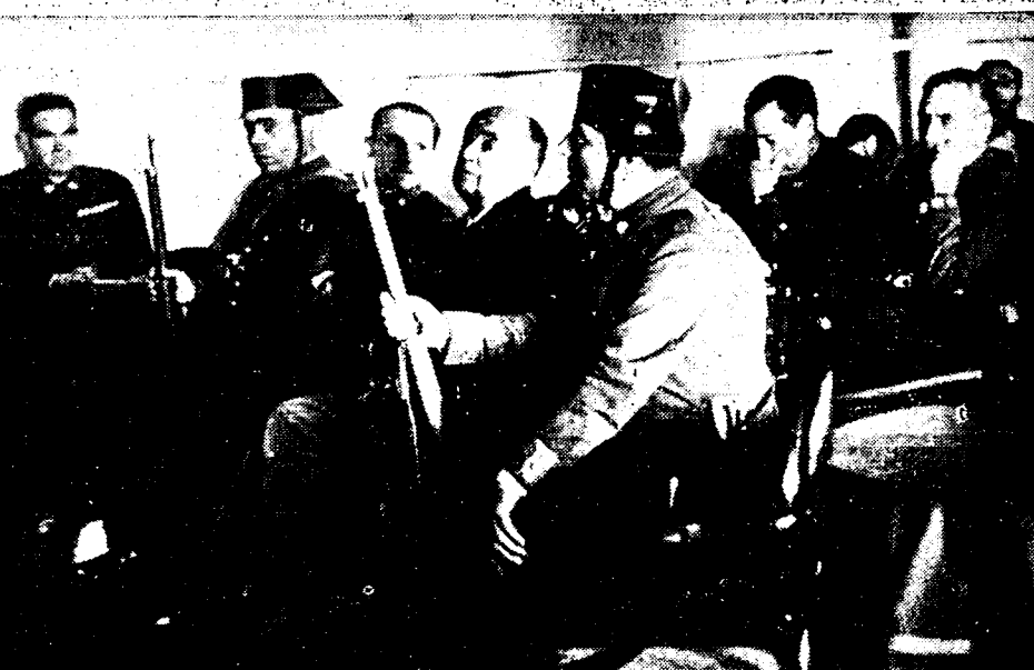
De krijgsraad in de eetzaal van de «Uruguay». Op de beschuldigingsbank, tusschen twee gards: de rebellen-generaal Goded (links) en Burriel. Deze foto werd ter plaatse door onzen medewerker opgenomen, enkele oogenblikken voor de doodstraf tegen beide opstandelingen werd uitgesproken

Een medewerker van «Vooruit» maakt een fotografische reportage aan boord van de «Uruguay» te Barcelona, op het oogenblik, dat de rebellengeneraal Goded en Burriel er ter dood veroordeeld werden