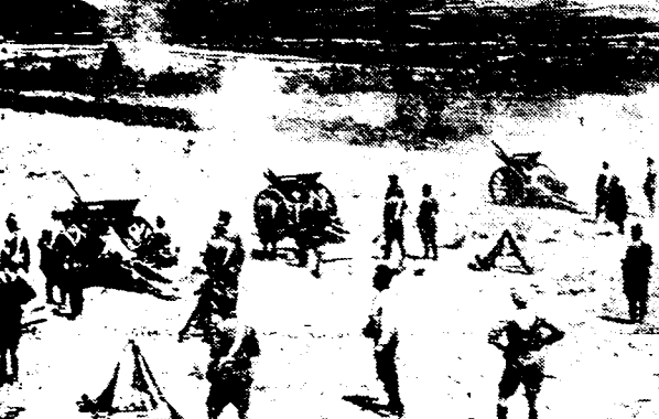
Kiekie van de nieuwe gevechten, aan gang op het front van de Sierra Guadarrama. Regeeringartillerie in volle actie.