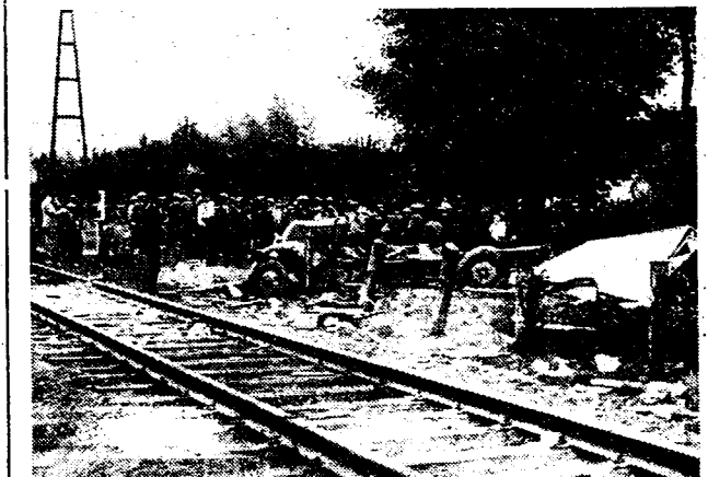
De spoorlijn te Destelbergen aan overweg 74, met er naast het versplinterde autoplein.