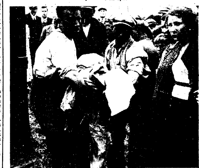
Te midden een ontroerde en met ontzetting geslagen menigte worden de lijken in een auto geladen en naar het doodenhuisje overgebracht