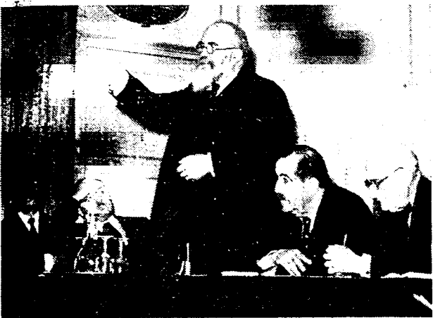
VOOR DEN VREDE

Donderdagmiddag werd te Parijs een groote internationale konferentie gehouden, waar talrijke deelnemers, in het licht van de gebeurtenissen in Spanje, den toestand en verschillende middelen tot beëindiging van het Europeesch fascistisch genootschap bespraken. Aan het bureau (rechtstaand) Louis de Broeckere, voorzitter der Socialistische Internationale; (zittend van links naar rechts): Professor Langevin, Jacques Duclos, kommunistisch volksvertegenwoordiger van Parijs, Jouhaux, voorzitter van de C. G. T. en, afgevaardigde van het Engelsch metaalarbeiders-syndicaat.