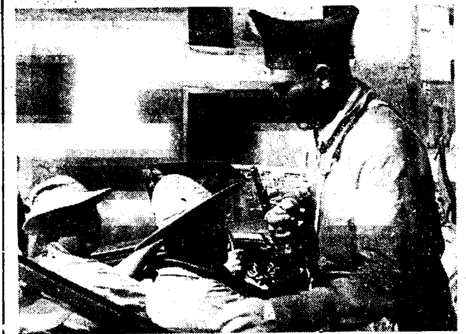
Generaal Duruti, een der aanvoerders der arbeiders-militieën op het Somosierra-front.