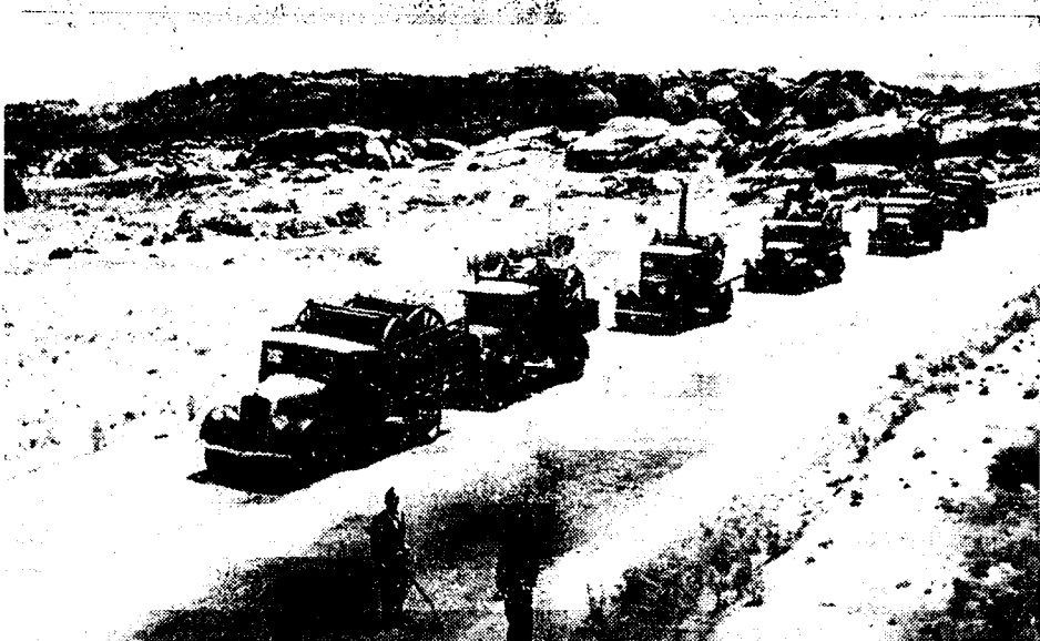
Langs talrijke lanen, bewaakt door militieën, trekken ten noorden van Madrid, den ganschen dag bevoorradingskolommen en kolommen met munitie op, naar de regeeringstroepen toe, die op het Somosierra-front meer en meer de rebellen achteruit slaan.