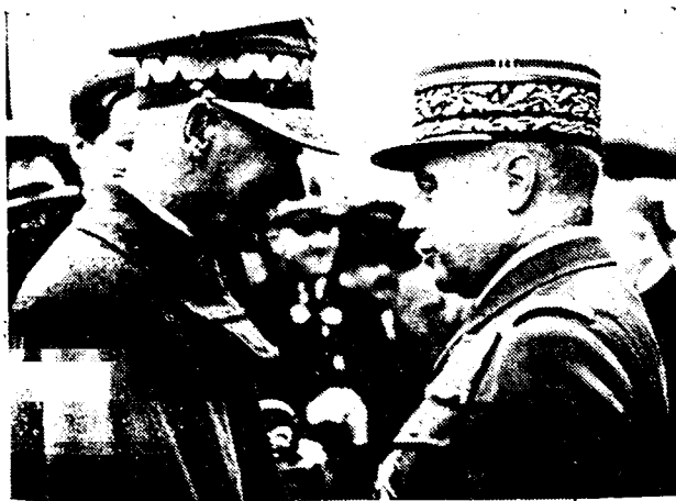
FRANKRIJK EN POLEN

De chef van den Franschen legerstaff, generaal Gamelin (rechts) wordt te Warschau door generaal Rydz-Smigly, opperbevelhebber van het Poolse leger ontvangen.