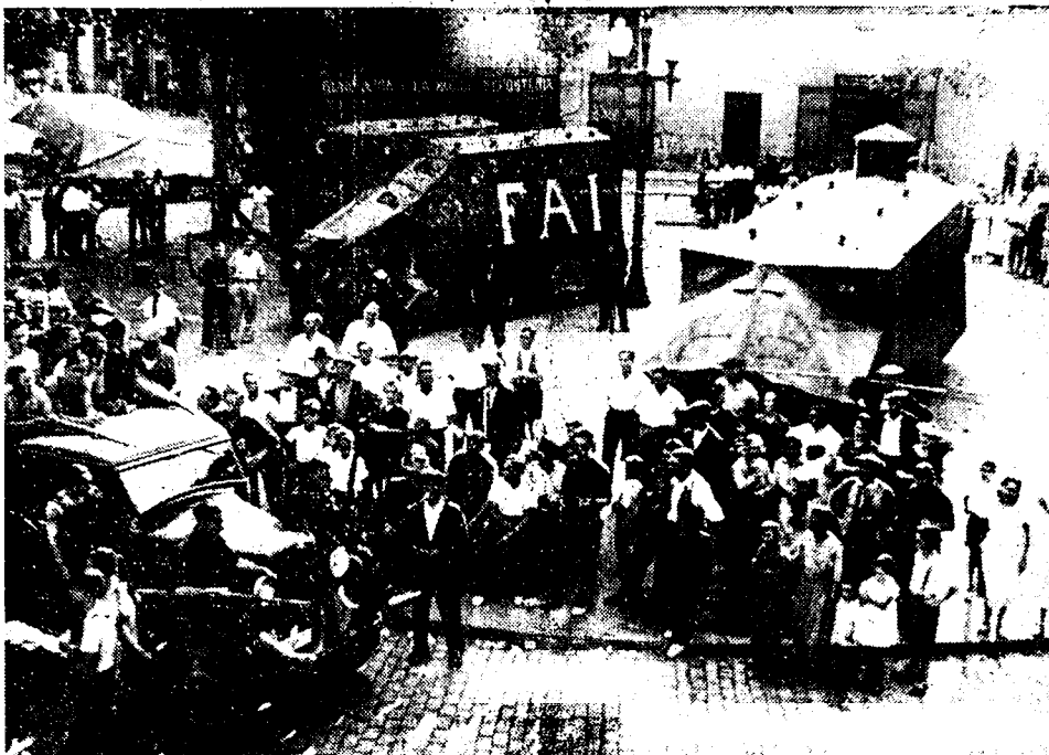
Talrijke in haast door de arbeidersmilities zelf gemaakte pantserwagens verlaten Madrid en vervoegen de fronten.