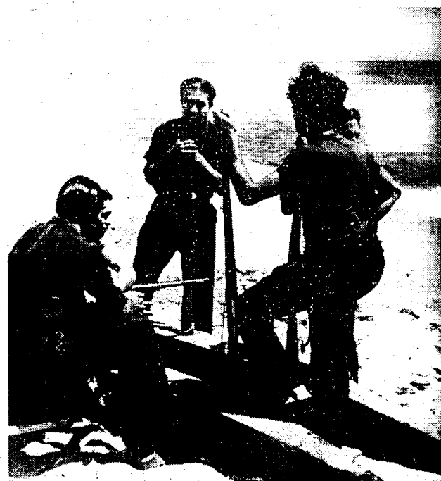
Pelotons arbeiders-milicies werden als wachten aan de zee, bij Tarragona opgesteld, ten einde eventuele aanvallen uit de lucht af te slaan (Foto van een onzer medewerkers ter plaats).