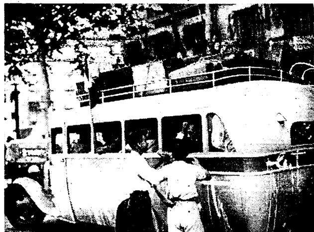
Fransche onderdanen verlaten, steeds talrijker Spanje. Te Barcelona worden zij met speciale autocars naar de haven gebracht, waar zij dan sloop kunnen gaan