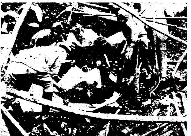
OP WEG NAAR SPANJE VERONGELUKTE FOKKER-VLIEGTUIGEN.