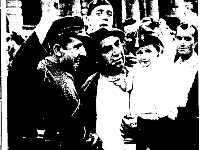
Een kleintje brengt het saluut van het «Fronte popular», op het oogenblik, dat vader naar het front gaat vertrekken.

Uit Burgos wordt gemeld, dat na een verwoed gevecht de stad Andoain, op het front van Guipuzcoa, door de opstandelingen werd veroverd. Bij Saragossa werden twee regeeringkolonnes met zware verliezen aan manschappen en materiaal, achteruitgeslagen. (Zie vervolg blz. 3)