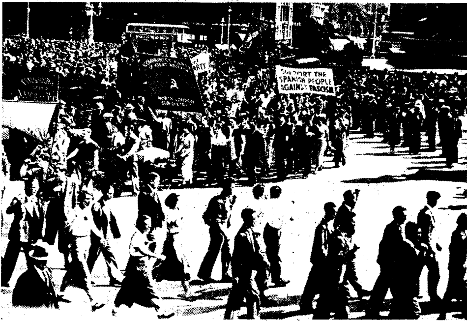
Londense arbeiders hebben in Trafalgar Square een grootsche betooging gehouden, waaraan duizenden betoogers behoorden tot al de linkse partijen, hebben deelgenomen. Het doel was de thans in den bloedigen oorlog gekwade Spaansche arbeiders van de sympathie der Engelsche arbeiders te verzekeren. De duizendkoppe manifestatie werd na een optocht, die uren duurde, door den socialistischen leider, Landsbury, toesproken.