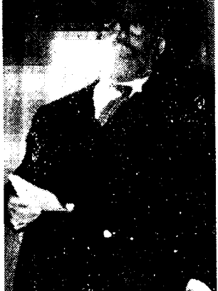
LOUIS DE BROUCKERE Voorzitter der Soc. Internationale