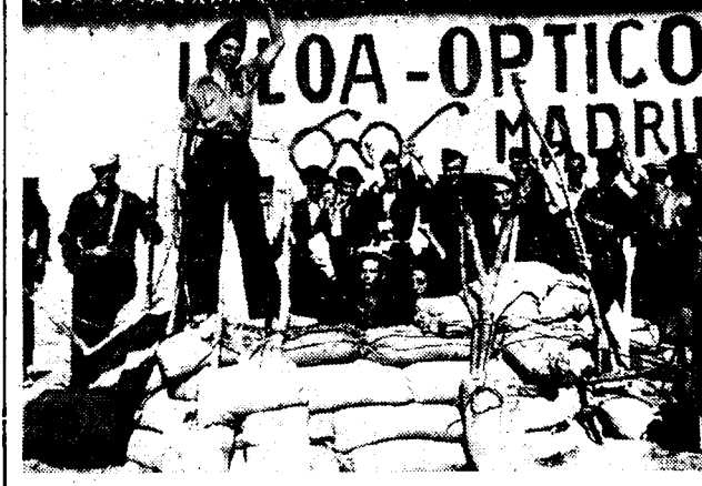
Stelling van de arbeiders-milities in een voorgeborchte van de stad Sigüenza, waarvan het binnengedeelte nog door de rebellen is bezet.