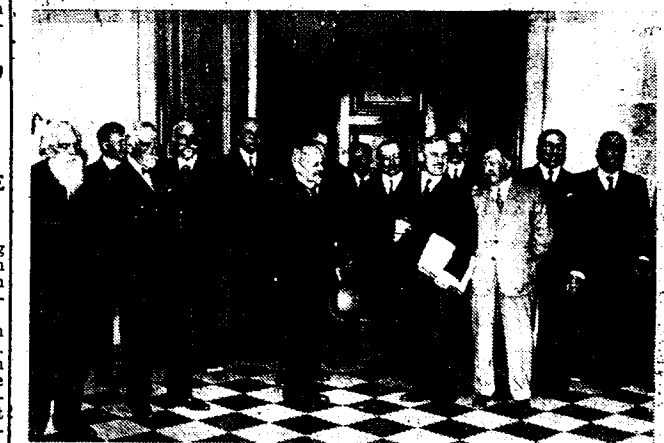
De h. Labeyrie, gouverneur van de Banque de France, heeft voor het eerst den nieuwen regentenraad bijeengeroepen, waarin talrijke technici, vertegenwoordigers van het Volksfront, hebben plaats genomen. Uiterst links bemerkt men Jouhaux, sekretaris van de C. G. T., eveneens tot regent benoemd.

In de eerste helft van September zal de inspecteur-generaal van het leger, Rydz-Smigly, het bezoek van generaal Gamelin beantwoorden. Onmiddellijk na zijn terugkeer uit Parijs wordt Samsonovici dan te Warschau verwacht, waar hij de gast van den chef van den Poolischen generaal staf, Stachiewicz, zal zijn.