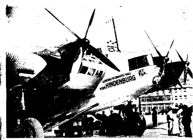
EEN DUITSCHE LUCHTREUS. Het grootste Duitse luchtvaartuig, een Junker C. 38, is op bezoek in Engeland. We zien hier het reusachtige toestel, dat 750 H.P. ontwikkelt en 34 passagiers vervoeren kan, op het vliegveld van Croydon.