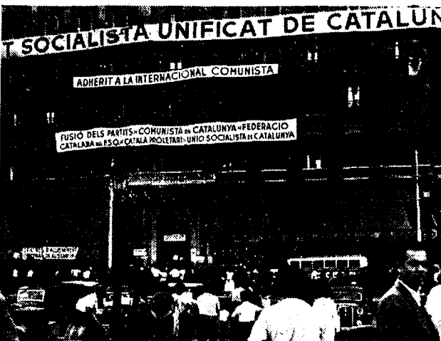
In het Hotel Colon op de Katalonjeplaats, te Barcelona, waar destijds de rebellen zich verschanst hadden en dat daarop door de arbeiders-militie werd bestormd en ingenomen, is thans de geünificeerde socialistische partij gevestigd. Ook bevindt er zich een uitgebreide verpleegdienst in deze lokalen, waar bovendien nog tweemaal per dag aan ongeveer 1000 families van arbeiders-militieleden levensmiddelen worden afgegeven.