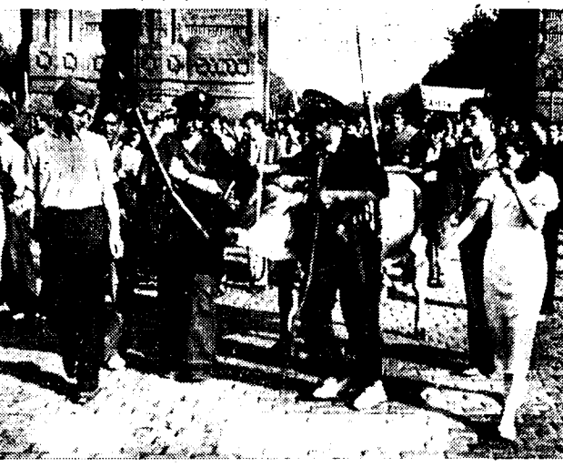
Een nieuwe kolom van 1000 arbeidersvrijwilligers verlaat Barcelona in opmarsch naar Sagrassosa. Zoals men ziet, neemt de kolom ook het vee mee voor de voeding der manschappen. (Van onzen medewerker ter plaatse).

werklidenpartijen en syndikaten bezet, ten voordele van hun leden.