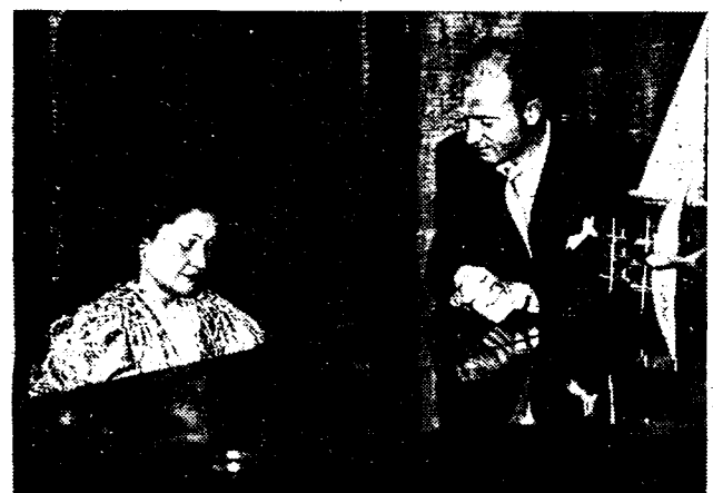
DETRE EN ZIJN ECHTGENOOTE. Een kiekje in de intimiteit van den Franschen vlieger Detré, die, zoodaals we gisteren meldden, het hoogterekord heeft geklopt door tot op 16.836 meter te stijgen.

Bijna allen hebben de kogelzak van de vroegere soldaten gekregen.