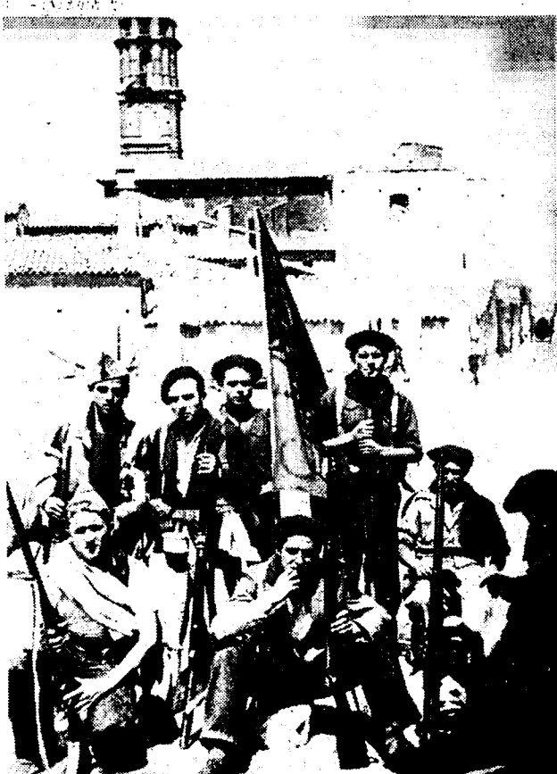
Fragment uit den strijd rond Saragossa. Een groepje arbeiders-militanten, die deelnamen aan de inneming van Azaila.