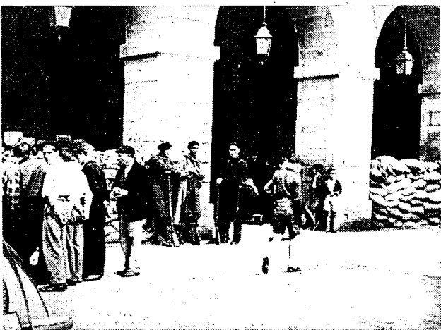
Het stadhuis van Irún in staat van verdediging gebracht en door arbeiders-militanten bewaakt.

Op het Guadarramafont behalen de regeringstroepen talrijke strategische voordeelen GRANADA STEEDS NAUWER INGESLOTEN