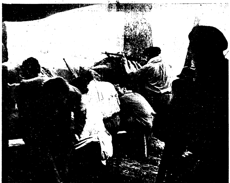
De verdediging van Irún door de regeringstroepen is hardnekkig. Onze foto toont een barrikade bezet door arbeiders-militanten in't volle van het gevecht.

Een der kleedjes voor den komende winter, die op dit ogenblik te Parijs de nieuwe mode-shows vertoond worden. Dit is bananaleurig en versterkt met een purperen ceintuur.