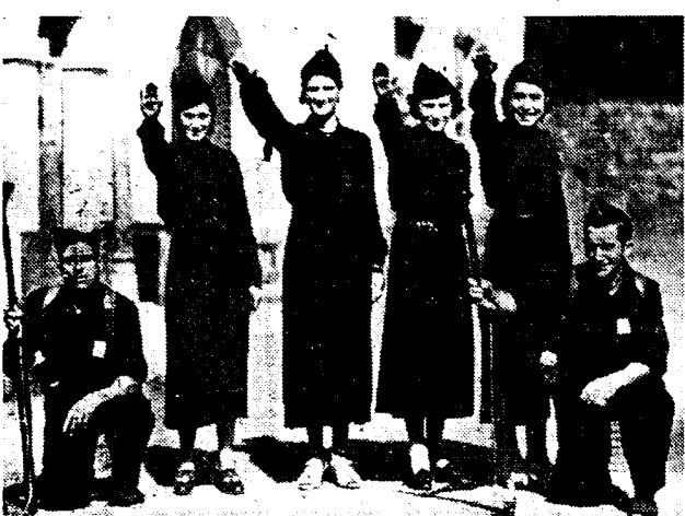
CARLISTISCHE VROUWEN DOEN MEE AAN HET FASCISTISCHE OPROER IN SPANJE.

Ook in de rangen der famerise Carlisten, die zich, zooals men weet bij de rebellen aansloten en die, zooals men ziet, op fascistische wijze groeier, werden problemen ingefield. Tot dusverre hebben de fascistische bladen het een "barbari" te meer genoemd, dat vrouwen langs den kant der arbeiders-militanten meestreden!