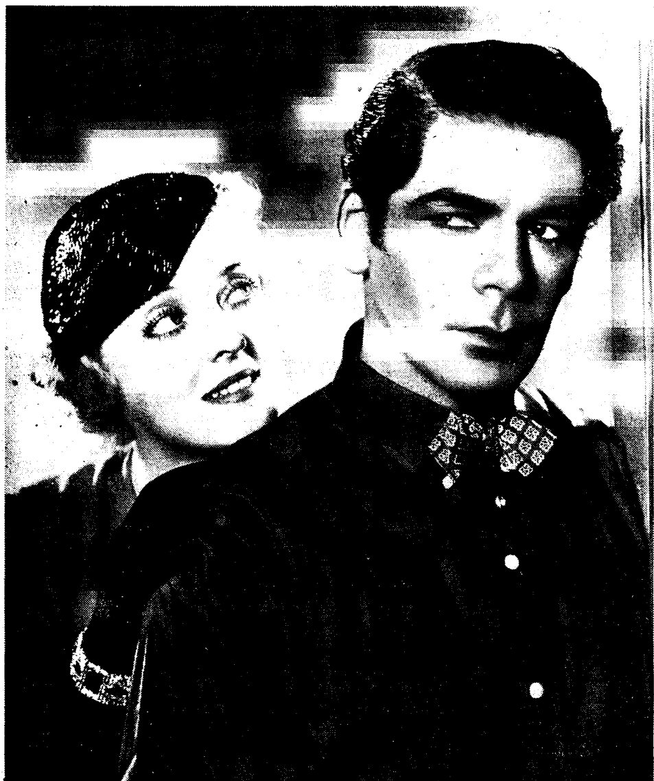
Bette Davis en Paul Muni in «De twee Werelden».