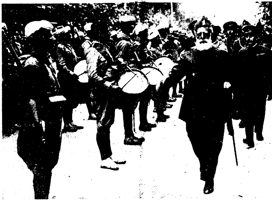
Bovenstaand beeld kenschetst beter dan welk betoog ook, de monsterachtigheid van den door de fascistische rebellen ontketend Spanischen burgeroorlog. Onze foto stelt het oogenblik voor waarop generaal Cabanellas, chef der rebellentroepen, die de Moorsche huurlingen uit Afrika naar Spanje overbracht, ze bij hun aankomst te Burgos in ongeschouwde toestand. Een strijd van de beschaving tegen de barbarij, aldus bestempelen de burgerbladen het Spaansche bloedbad. Een document als bovenstaande bewijst voldoende aan welken kant zich de «barbarij» bevindt!!