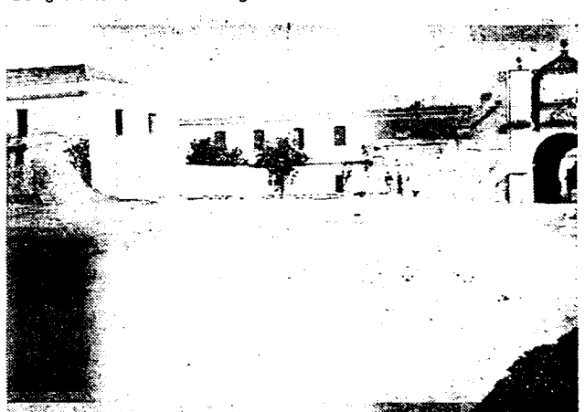
Een kiekje uit het thans door de rebellen bezette Badajoz, dat de bres zien laat, langs dewelke de militaire fascisten, dank zij het verrad hunner handlangers in de stad konden binnendringen.