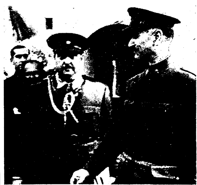
Twee der verantwoordelijke Spaansche bloedhonden, gekiekt te Sevilla. Rechts: generaal Queipo de Llano, de grootste radio-zoetser van de wereld; naast hem: generaal Franco, de man, die zijn volk heeft verraden, en die het met de medehulp van zwarte huurlingen en verloopenen sukkelen van het vreemdelingenlegioen hoopt uit te moorden!