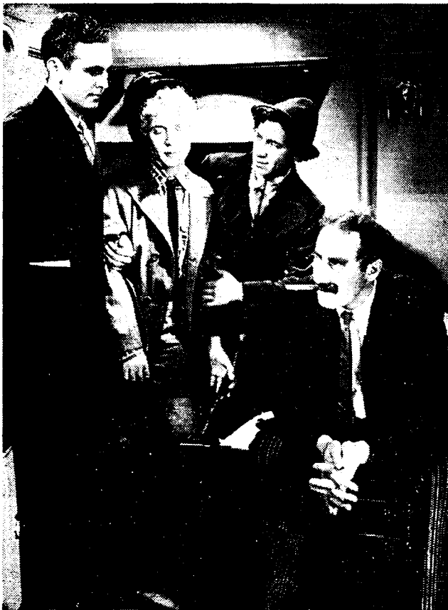
Tooneel uit de film «Een nacht in de Opera». Links Allan Jones, die de rol van den tenor speelt. Naast hem, van links naar rechts; de dolle broeders Harpo, Chico en Groucho Marx.