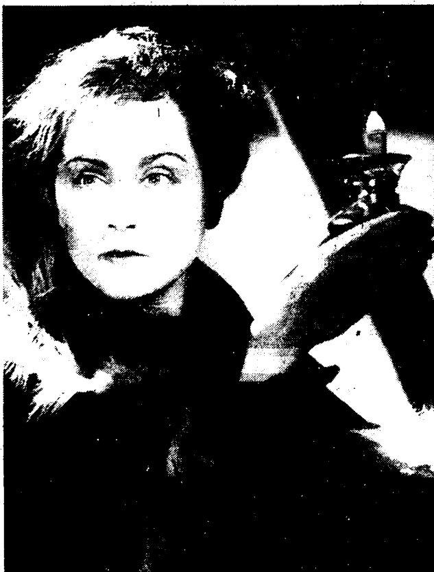
De Russische filmspeelster, Espir a in «De matrozen van Cronstadt».