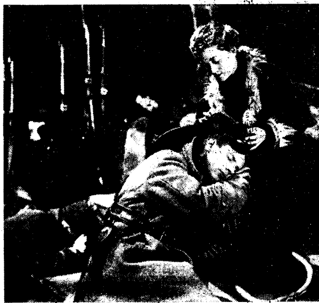
Tooneel uit de film «De matrozen van Cronstadt». Espir, in de rol van de onderwijzeres Katharine Tatman, en Boëchoefje in de rol van den matroos.