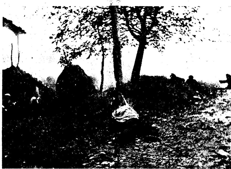
In de streek rond Saragossa wordt harder en harder gevochten. Ziehier een afdeling militairen bij een aanval op een door rebellen bezette hoeve, die zij kort daarop innamen.