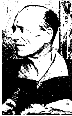
Generaal Milan Astray, aanvoerder van het soldatesk gespuis, dat het Spaanse vreemdelegioen uitmaakt. Zoals zijn ge-laatstreken het ten andere wetsprekend zien laten, behoort dit rebellenhoofd tot de categorie der «beschavers» met den revolver.

De regeeringsvliegers voeren talrijke succesvolle aanvallen uit DUBBELZINNIGE HOUDING DER PORTUGEESCHE REGERING