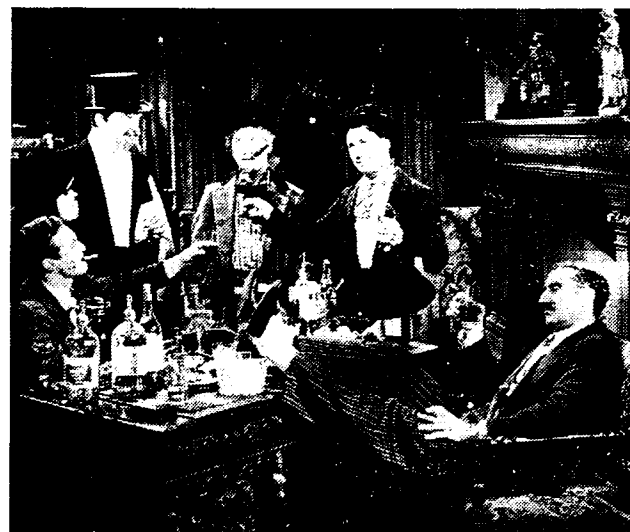
Een der geestigste tooneelen uit de film «Een nacht in de Opera», waar men de Marx-broeders bezit nemen ziet van het bestuursbureau van de Opera.