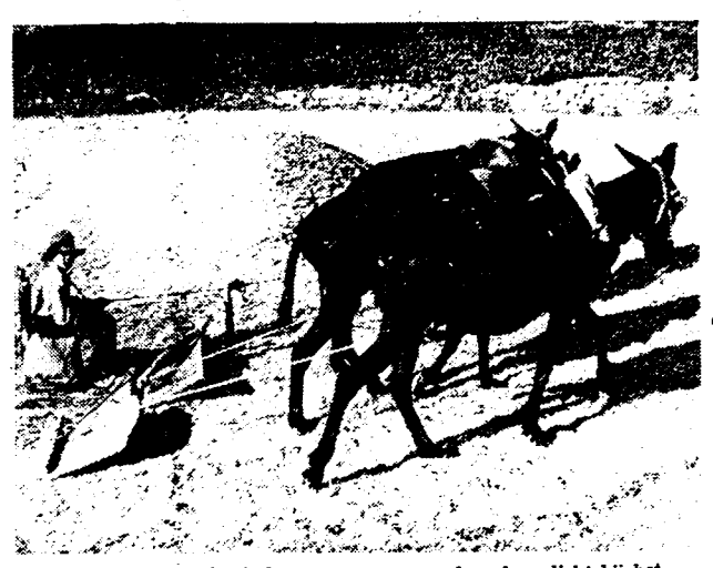
Typisch Spaansche landschap, door een medewerker, dicht bij het front bij Saragossa opgenomen. De bewerking van den Spaanschen grond is niet slechts een lastige karwei, maar gebeurt bovendien met primitieve middelen, zoals men ziet.

De aanvoerder is veroordeeld tot 5 jaar tuchthuis en 5 jaar verlies van burgerrechten. 15 medeplichtigen kregen tuchthuisstraffen van 2 tot 4½ jaar, 8 anderengerechtigdenstraffen van 1 tot 2½ maanden, 4 beklagden werden vrijgesproken en 2 vielen onder de bepalingen van de amnestiewet.