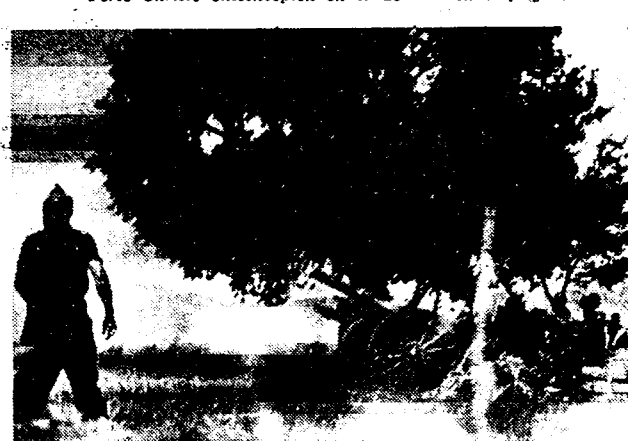
Militie-artillerie te Sietamo, bij Huesca, in een verworpen strijd gewikkeld tegen de rebellen, die op dit punt achteruit geslagen werden.