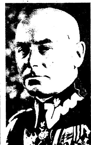
GENERAAL RYDZ-SMIGLY opperbevelhebber van het Poolsche leger, die heden te Parijs verwacht wordt en wiens bezoek aan den Franchen legerstaaf van groote politieke betekenis voor den toestand in Oost-Europa zou kunnen zijn.

Tandler bleef niet lang in gevangenschap. Hij werd vrijgelaten en keerde naar China terug. Onlangs kreeg hij een uitnodiging uit Moskou daar ter stede de gemeentelijke gezondheidsvoorzieningen te organiseren. Tijdens dit werk heeft zijn hart hem in den steek gelaten. In de eerste plaats staan zijn politieke vrienden treurend aan zijn baar, maar het licht geen twijfel dat ook zeer veel personen uit het vreedelijken kamp met eerbied den groeten Oostenrijker zullen gedenken.