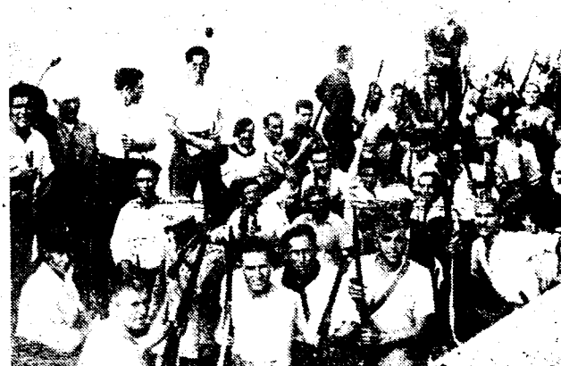
Militanten op Mallorca, gekickt even voor het oogenblik, dat zij te Porto Christo ontscheepten en er de rebellen verjoegen.

Dr. Schacht antwoordde: «Ik ben zeer tevreden over de uitkomsten van die reis».