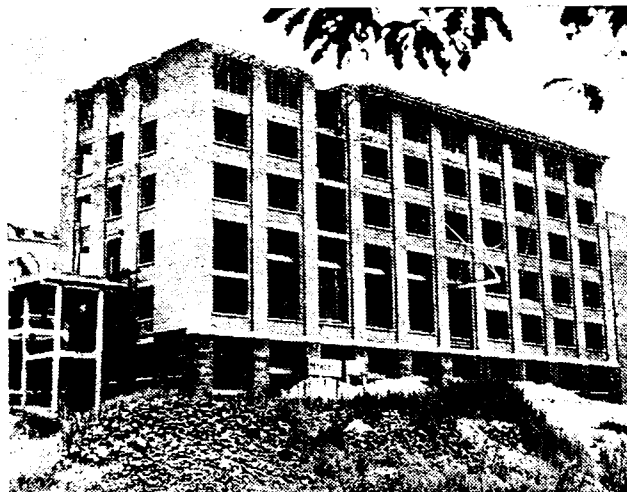
UITBREIDING DER GENTSCHE HOOGESCHOOL. De nieuwe gebouwen, aan de Sint-Pietersnieuwstraat te Gent, waar de Universiteit haar technische diensten en laboratoria onderbrengen gaat, vorderen snel.

Te Londen is de tekst van de Britsch-Egyptische overeenkomst, die in de Locarno-zaal van het Foreign Office is ondertekend, bekend gemaakt. Dit verdrag maakt een einde aan de militaire bezetting van Egypte door de Britsche krachten en regelt het bodgenootschap tusschen de beide landen. Het verdrag is van kracht gedurende een periode van twintig jaar, maar besprekingen over hernieuwing van het verdrag kunnen, indien de beide partijen dit wenschen, na tien jaar plaats vinden.