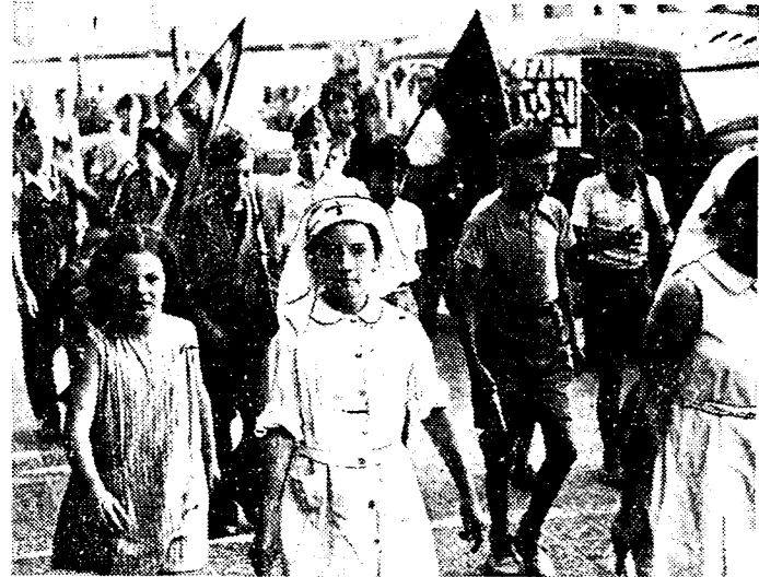
Een kiekje uit de straten van Barcelona. Kinderen behoorende tot de linkse groepelingen houden optochten, waarbij het hen om doen is geld in te camelen ten bate der families der militieleden.

Verder bevindt zich nog een groep van 30 militieleden achter een barri- cade, ook uit huizen wordt nog ge- schoten.