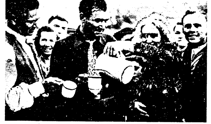
Bij hun noodlanding in Wales, werden de koene Amerikaansche vliegers Dick Merrill en Harry Richman, onmiddellijk door de landelijke bevolking van den omtrek omringd en gelooft

Toch hebben zij een vliegprestatie van eersten rang geleverd. Zij vol- brachten den oceaantocht in den rekordtijd van vijftien uur, vliegend met een gemiddelde snelheid van 335