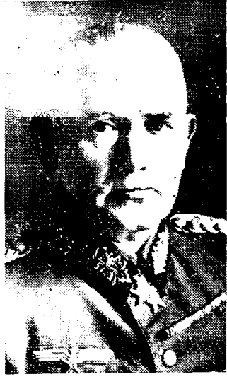
GENERAAL VON BLOMBERG

sen werd opgeheven deden zich heftige incidenten voor: formalities werden ont- wepend en leiders en militanten in koncentratiekampen opgesloten.