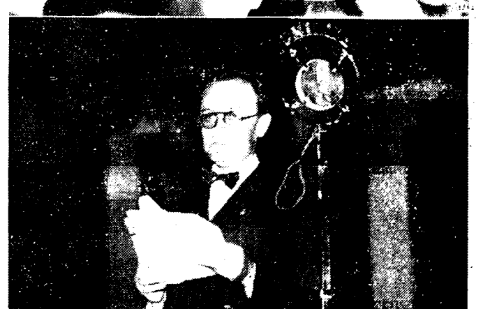
ENKELE FIGUREN VAN HET WERELDKONGRES VOOR DEN VREDE Boven: 1. Schoenick (Russisch afgevaardigde); naast hem pgt. Em. Vandervelde, die de groote openingsvergadering voorzag; 2. Lord Robert Cecil spreekt voor de radio tot de Amerikaanse luiste- raars; 3. Mevr. Fritof Nansen (Noorsche afgevaardigde), vrouw van den bekenden ontdekkingsreiziger; 4. en 5. De Fransche af- gevaardigden Herriot, staatsminister, en Pierre Cot, minister van Luchtwezen.