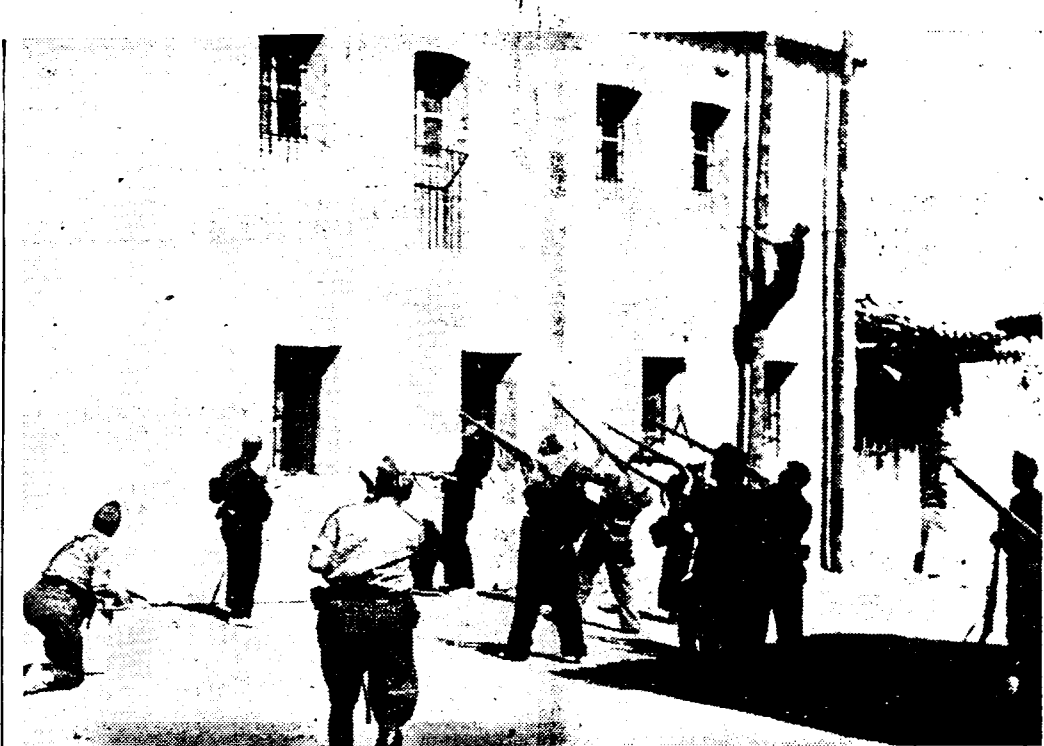
Een episode uit den zegevierenden strijd door de regeringstroepen in Estramadura gevoerd. Een bataljon militair treedt het stadje Valdelacasa binnen en maakt een aanvang de gebouwen te zuiveren, waar zich nog rebellen schuil houden.