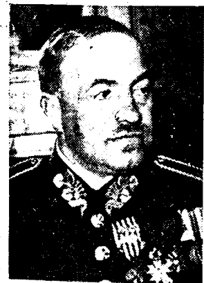
DE GENERALEN REIZEN...! Generaal Kéji, stafvoorzitter van het Toekoe-Slovaaksche leger is op zijn beurt op bezoek te Parijs.