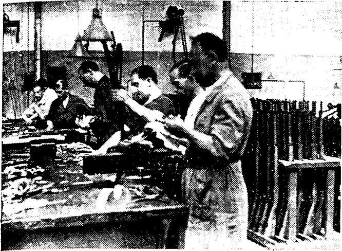
Een opname in een wapenfabriek van de Katalaanse regering.

(Van een bijzonder korrespondent ter plaatse).