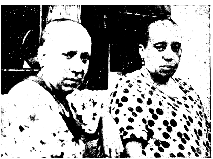
OPGEDRAGEN AAN ONZE REAKTIONNAIRE GRUWELPERS Een authentiek foto-dokument dat een schril licht werpt op de «hoogbeschaafde» zeden van de rebellen-benden. Twee Baskische vrouwen, die bij de bezetting van Irun den moed hadden «Leve de Baskische nationalisten!» te roepen, werden door de fascistische aangehouden en het hoofdhaar afgeschoren.

Te Brussel hebben de vliegers zich per slot van rekening aangemeld bij de rijksmacht, daar ze als deserteurs geboekt stonden.