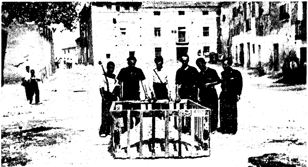
Op het marktplein van een klein dorpje aan het Aragon-front wordt een gesneuveld militair door zijn kameraden met roerenden eenvoud ter aarde besteld

HOE ITALIE, DUITSCHLAND EN PORTUGAL DE NIET-INMENGING SABOTEEREN