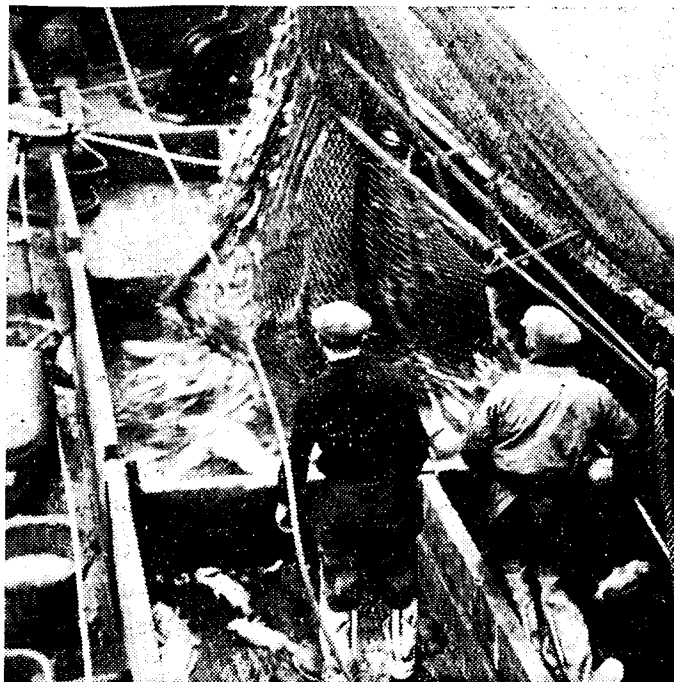
De vischaak, van zijn strop ontdaan laat zijn buit vallen

den de groote visschen in een afzon- derlijk kompartiment worden, ook de andere visch wordt nu verdeeld naar de hoedanigheid en behandeling.