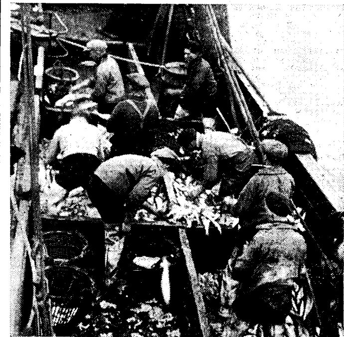
Men zoekt de visch uit, hij wordt geruimd en gereinigd voor de bewaring

Daar ligt de vangst en reeds maakt men het net opnieuw klaar