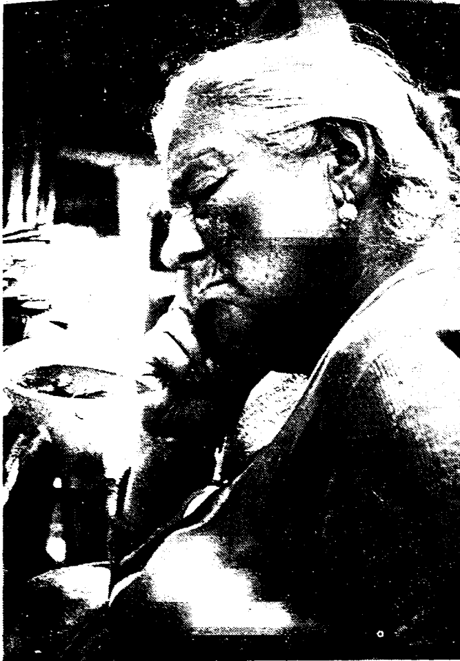
Een oude gedrukt onder den kommer voor den dag van morgen.

De aanpassing der pensioenen en een wijziging aan de uitbetaling dringen zich op