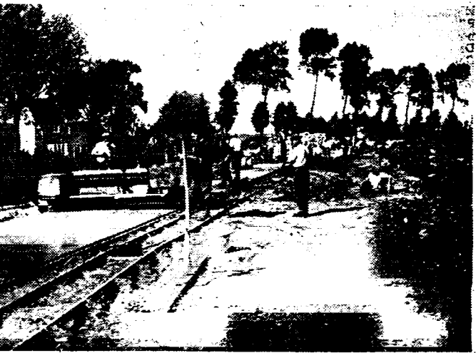
VERBETERING VAN DE WEGENIS IN VLAANDEREN Thans is men bezig de oude baan Brugge-Gent over het grondgebied Asselme-Enkelare, Alter enz. recht te trekken en te makadamiseren. Het is reeds tot op het grondgebied Oedelem georderd, op de wijk Vliegende Dier. Het op deze plaats dat Philips van Artevelde in 1332 gereed maakte tot den slag tegen de Bruggelingen.