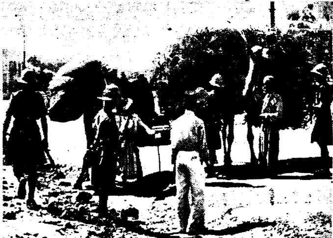
IN PALESTINA Op den weg van Betelehem, in Palestina, bij het eeuwoudde graf van Rachel, worden Arabische kameeldrijvers, verdacht van wapensmokkel, door Engelse soldaten tegengehouden en aan grondig onderzoek onderworpen.

Vlaanderen heeft met gansch dat fascistisch gekonkel niets te maken. Middenin het gekraak van het kapitalistisch kraam moeten de openlijke bevechters van het kapitalisme, moeten «de rooden» onschadelijk worden gemaakt. De bourgeoisie wil haar revolutie en zij maakt van de kleinburgerij haar stoottroepen.