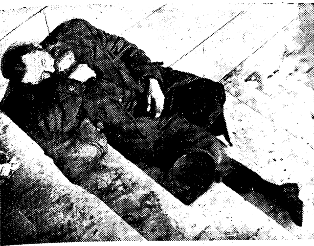
Een oudje op den dorpel...

Met ongeduld wordt op een daad van de regeering gewacht