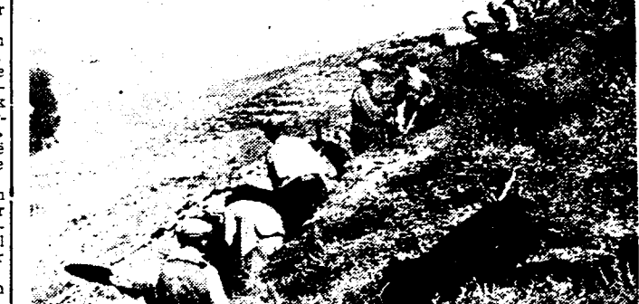
VOOR DE VERDEDIGING VAN MADRID Vrijwillige arbeiders, die den oproep van de regering hebben beantwoord, zijn bezig loopgraven en versperingswerken aan te leggen in den omtrek van Madrid.

DE MOHAMMEDANEN, DIE DE KRISTEN BESCHAVING KOMEN REDDEN... Het aantal soldaten, in de jongste dagen van Marokko naar Spanje overgebracht, bedroeg 16.000. De nationalistische vloot verzekert de overbrenging. (Zie vervolg bladz. 5)