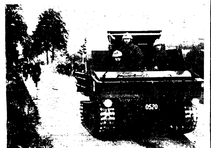
BELGISCHE LEGEROEFENINGEN Grote legeroefeningen zijn aan gang in de streek van Luik. Een kleine tank gaat ter bescherming een wielrijdersafdeling vooraf.