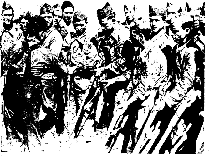
VRIJWILLIGERS VOOR DE VERDEDIGING VAN MADRID Duizenden nieuwe vrijwilligers, oproepen voor de verdediging van Madrid, krijgen thans hun onderricht in het hanteren der wapens.