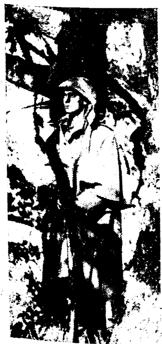
OP POST IN DEN KOUDEN NACHT

Hevige gevechten aan gang in den sektor van Navalperal