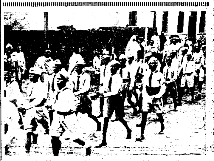
ITALIAANSCH BESCHAVINGSWERK IN ABESSINIE Maarschalk Graziani laat te Addis-Abeba de Abessijnische jeugd tot soldaten drillen. Dit is wat men de beschaving der koloniën heet!

Op de vragen van de non-interventiekommissie zal Duitschland in het begin van de volgende week een kort antwoord zenden, waarin de beschuldiging als ongegrond van de hand wordt gewezen. Overigens hoort men hier van gezaghebbende zijde, dat als mocht blijken dat er enige Junkers, Heinkel en Dorniervliegtuigen aan de zijde der realschen worden gebruikt, dit vliegtuigen zijn, welke van partikuliere Duitse zijde aan de Spanische partij worden geleverd voordat Duitschland tot de embargo-overeenkomst toetrad. Of deze argumentatie ook in de antwoordnota zal worden opgenomen, is onbekend.