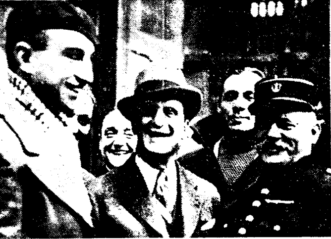
DE GROENE GLIMLACH VAN DEN KOLONEL Zooals we gisteren meldten werd de fameuze chef der Fransche Vuurkruisen bij den onderzoeksrechter ontboden. Kolonel de la Roque, die we hier bij zijn aankomst in het Parijsche Gerechtshof zien, wordt beschuldigd van wederoprichting van ontbonden groeperingen en van ophitsing tot samenspanning. De kolonel heeft verklaard, dat hij er zijn glimlach niet zal bij inschieten. Maar lachen en groen-lachen zijn twee!