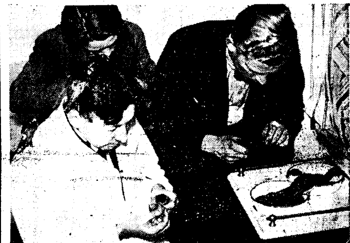
HULP AAN ZWALUWEN

Zoals we gisteren meldten werden door de bevolking van Weenen eenige duizenden door de koude verkleumde en van honger half bezweken zwaluwen gevoed en verzorgd. Daarna werden de zwaluwen per spoor en per vliegtuig naar Venetië vervoerd. In dat land werden zij andermaal gespoed en in de zee te zijn vervoerd, konden zij hun tocht naar de warmere landen voortzetten.