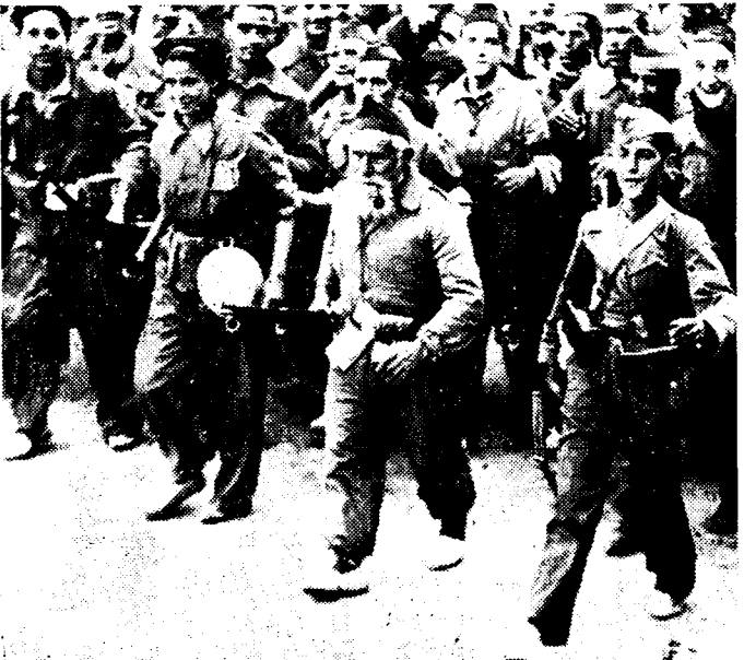
DE OUDSTE EN DE JONGSTE MILITIANEN

Het radiostation te Felguera meldt, dat de regeringstroepen te Oviedo zich