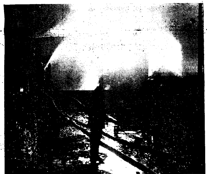
Een kiekje van den reusachtigen brand in de olie-tanks van de Antwerp Oil Works, te Hemiksem bij Antwerpen.

De brand, Dinsdagavond uitgebroken, woedt nog steeds voort