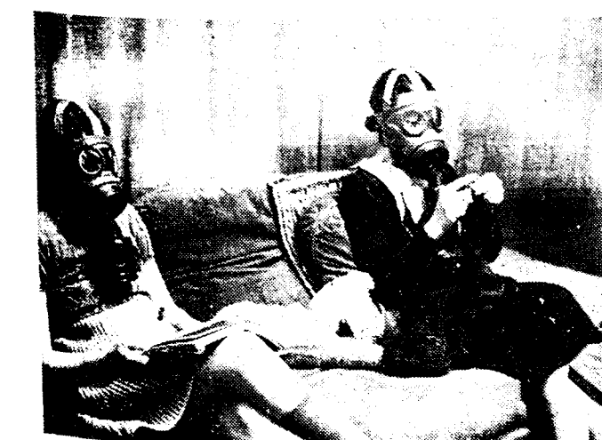
TEGEN GASAANVALLEN. De gansche Parijsche bevolking is vandaag uitgenoodigd mee te doen aan de algemeene oefeningen tegen gebeurlijke gasaanvallen. Deze oefeningen worden zowel op straat, gelijk binnenhuis gehouden. Onze foto toont, hoe na de veruiting, dat een gasaanval op komst is, moeder en dochter zich van hun gasmasker bedienen. Laten we intusschen niet al het mogelijke doen, opdat dergelijke tooneelen geen werkelijkheid zouden worden!

(We herinneren er aan, dat Thorez in feite niets anders heeft gedaan, dan aanhalingen uit Hitler's «Mein Kampf». En dan...?)