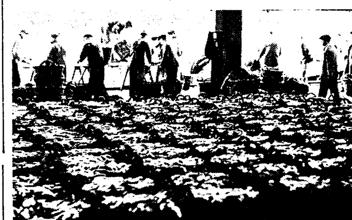
«NIEUWE» VERSCHIE HARING. De haring heeft in groote hoeveelheid zijn verschijning gedaan. Onze foto toont een vracht van belang, aangekomen in de Oostendse vischmijn. Nog een geluk, dat men hem niet, zooals in zekere landen, terug in zee smijt!

Vier der omstaande kinderen liepen brandwonden op, terwijl hun kleeders vuur vatten. De kleine slachtoffers werden, gewond, naar het hospitaal overgebracht.