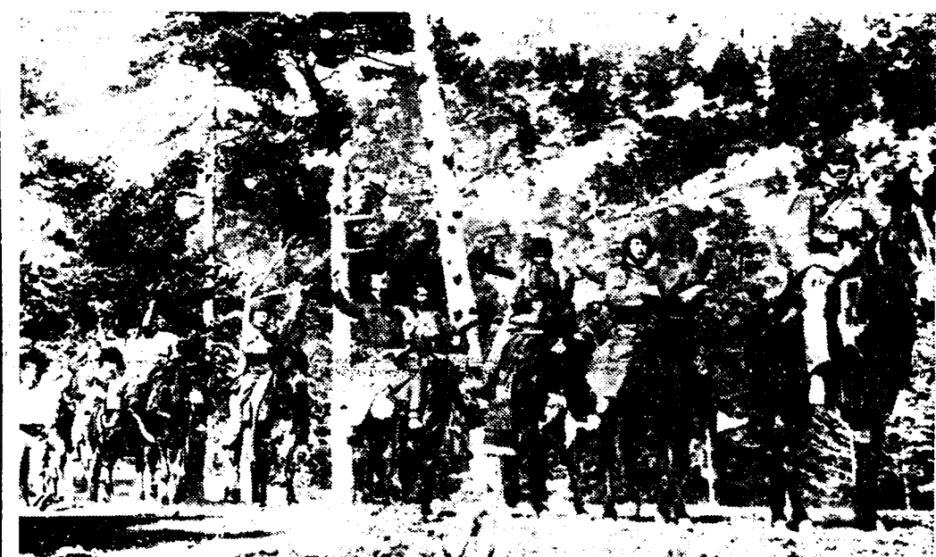
SPAANSCH REGERINGSKAVALERIE. Een groep bereden militanen, opereert met sukses tegen de rebellen in de Sierra Guadarama.

Op de vraag of er ook gesproken werd over het gezamenlijk ontslag, waarmede Degrelle dreigt, antwoordde hij, dat die kwestie in de vergadering niet te berde is gekomen. Bij de golf van verontwaardiging en van verzet, die thans over het land gaat, naar aanleiding van het monsterbedrog «Flandrex», zullen die heer-schappen wel tweemaal nadenken alvorens een nieuwe volksuitspraak uit te lokken. Ten ware, dat zij naar een voorwendsel zochten waarmede zij de geldverspilling, die zij door nieuwe vertekeningen zouden verwekken, zou-buikeren. Het is niet te ontkennen, dat de hangeren, de mannen van de orde (?) en van de zuinigheid, waar het arbeidersbelangen betreft althans.