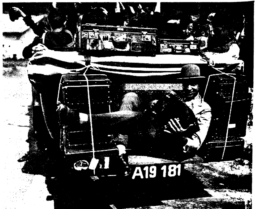
TOONEEL UIT DE FILM «DE LENTE ZINGT».

Eerlang zal in de Vlaamsche film-wereld een comité in het leven wor-den geroepen die de Vlaamsche belangen en inzichten in dezer zake zal beartigen bij voornemde subkom-missie.