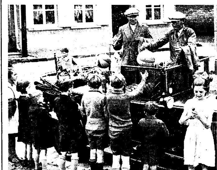
MODERNE «VODDENRAPERS». De moderne koninkrijken van den vanden «voddennapper van Parijs», rijden tegenwoordig de Vlaamsche dorpen af. Zij kennen er groot succes bij de jonge dorpsvrouwen, aan wien zij in ruil voor wat zoogezegd «brot» allerlei speelgoed bieden.