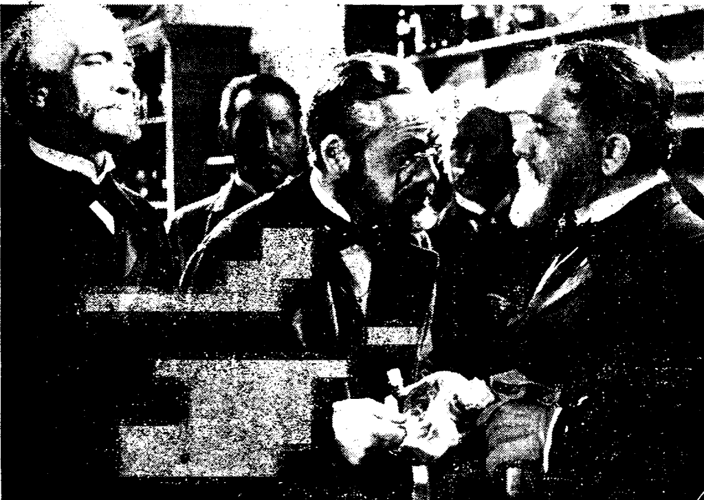
TOONEEL UIT DE FILM «HET LEVEN VAN LOUIS PASTEUR», IN HET MIDDEN PAUL MUNI, IN DE ROL VAN PASTEUR.