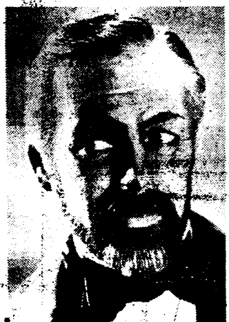
Karakterkop van Paul Muni als Pasteur.

Amerika blijft ondanks alles het land der mogelijkheden. De wereld-geschiedenis heeft het dikwijls moeten ondervinden: brokstukken uit de geschiedenis werden op spektakulaire en sensationele wijze uit hun evenwicht gelicht en tot een onmogelijk avontuur, een koninklijk heide-verhaal of een onverklaarlijk draak herleid. De wetenschap bleef ook niet onaangetast. In talrijke films werd de wetenschap der toekomst als een onmogelijk sensationeel voor-gesteld. Maar Hollywood bood ook gunstiger mogelijkheden.