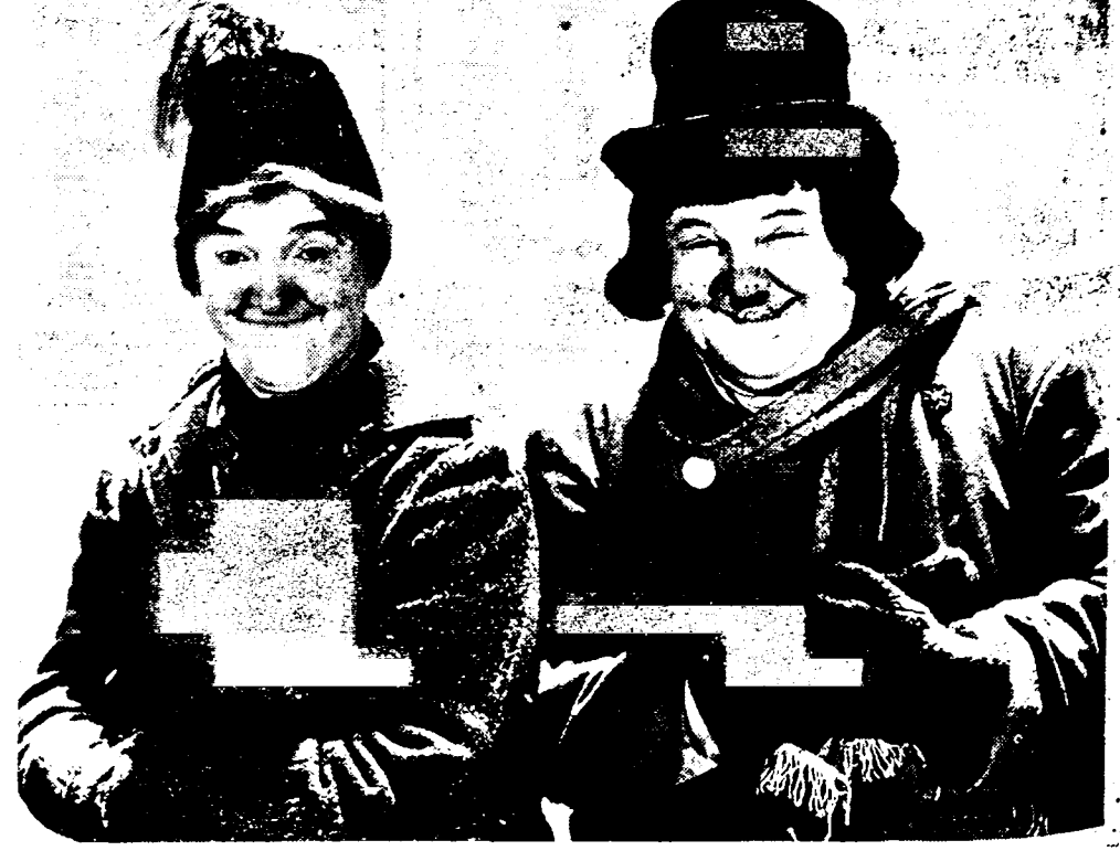
Laurel en Hardy, in de film «DE BOHEEMSTER».

In filmmuziek zit heel wat geld. In den handel erin zit muziek. Zoveel muziek, dat zoo pas door Warner Brothers een overeenkomst is gesloten, waarbij ze een reeks processen annuleerde, die de maatschappij een bedrag aan schadevergoedingen had moeten opslerven van een kleine vier miljoen dollar. Hotels, music halls, cabarets, de radio en wat al niet laten vaak filmschlagers spelen. Ze betaalden daarvoor aan een bureau voor auteursrechten, dat echter slechts een klein percentage aan de filmaatschappij wilde afdragen. Men heeft de kwestie ten slotte maar onderling geregeld en Warner Brothers kunnen op enkele miljoenen meer rekenen.