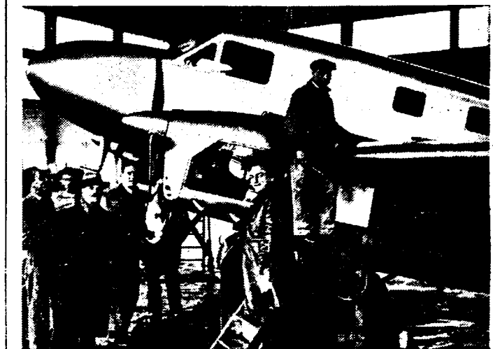
PARIJS-SAIGON: 22.000 KM. Verscheidene vliegtuigen zullen Zondag te Parijs de lucht ingaan, deelnemende aan de snelheidsrucht naar Saigon, die over een afstand van 22.000 km. loopt. Een der deelnemers is de Franse vlieger Arnoux (in het midden op het voorplan), die hierbij een nieuw Caudron-toestel in de race brengen gaat.

Reizigers deden in het station van Gijsegem een akelige ontdekking. Enkele oogenblikken voor het aankomen van den reizigerstrein 4782, die te 6.24 uur te Gijsegem uit Dendermonde toekomt en naar Aalst rijdt, zagen reizigers een massa op de spoorstaven liggen. Bij het naderen zagen zij met ontzetting dat het het lijk van een manspersoon, dat middendoor was gereden. Naast het lijk lag een spade. De reizigers verwittigden den stationsoverste, die het lijk in het pakhuys van het station deed overbrengen. Het kon geïdentificeerd worden, waaruit bleek dat het zekere Van Gijsegem Alexis was, 35 jaar oud, ongehuwd, die met zijn vader woonde in de gemeente op de wijk Dries. Dokter Jozef Brijls stelde den dood vast. Het parket van Dendermonde werd verwittigd.