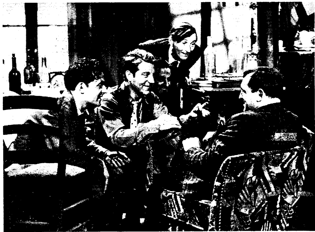
Tooneel uit de film «DE SCHOONE PLOEG». Op onze foto bemerkt men de drie voornaamste leden van den «ploeg»: Jean Gabin, Charles Vanel en Aimos.