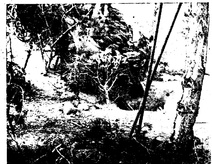
« PHANTASMA » « Phantasma » aldus de benaming die de militanen geschonken hebben aan een gedeelte van de woeste bergstreek op het Teruifront (Valencia), waar een heftig verzet opgestaan is, die sedert weken met sukses de stellingen der rebellen bestookt en alle aanvallen van rebellen-vliegtuigen heeft afgeslagen. Onze foto toont een der gekamoufleurde kanonnen deser batterij.

MEN LEZE OP BLZ. 3: Het verslag van den ministerraad, waarin tot het verbod van den rexischen « marsch » op Brussel » besloten werd. — De radiorede, gisteren avond door den h. Van Zeland uitgesproken en waarin de eerste minister dezen maatregel motiveert.