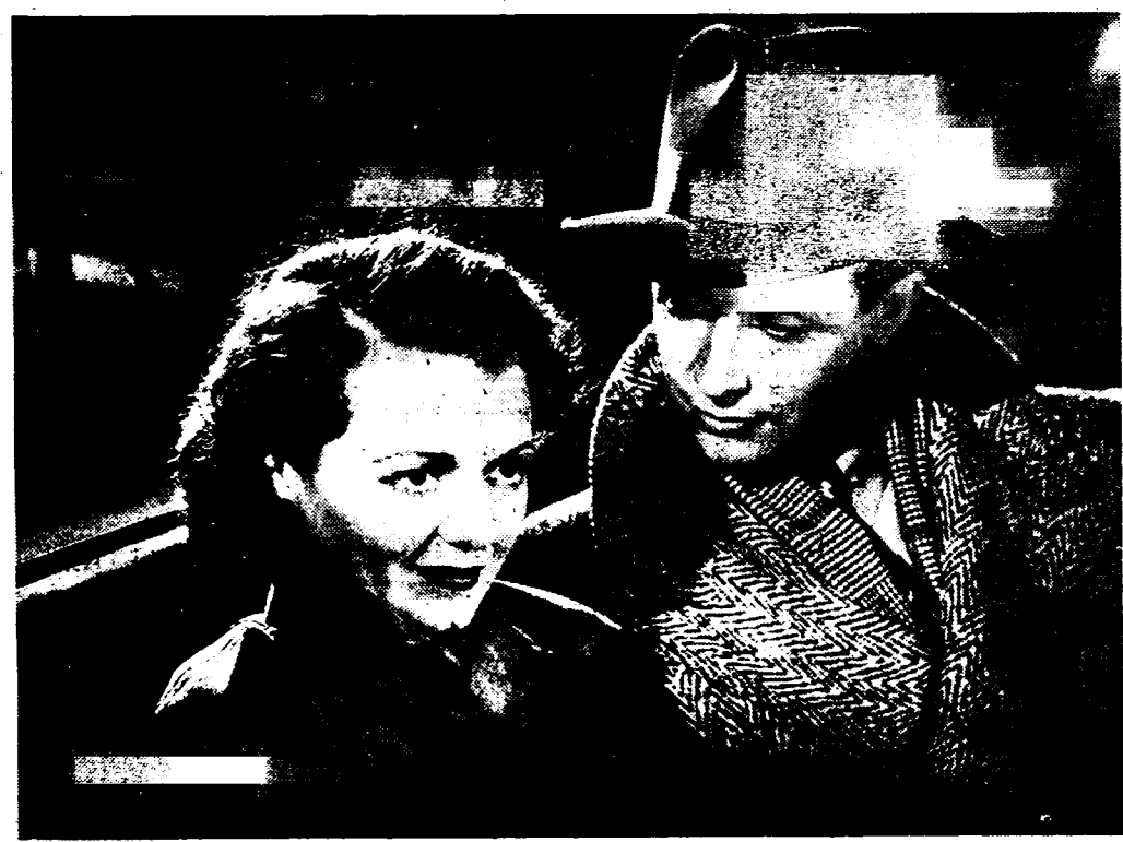
Janet Gaynor en Robert Taylor, in de film «HET MEISJE VAN DE LANDE»