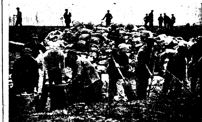
DE DIJKBREUK OP DE DURME TE WAASMUNSTER. Met gezamenlijke krachten hebben de bewoners van de streek tegen het gevaar van den waterloof gestreden. Honderden zandzakken werden als dam opgevoerd in de door het water ingebeukte dijkleuf.