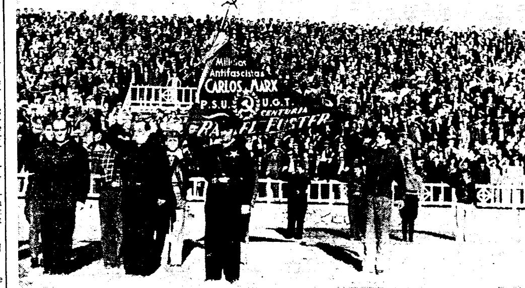
HET KARL MARX-BATALJON NAAR HET FRONT. Altoeren Barcelona te verlaten, met bestemming naar het noordelijke striidfront, heeft het Karl Marx-bataljon voor duizenden sympathisanten in het stadion een opmars gehouden. Op het voorplan, de officieren die het bataljon aanvoeren.