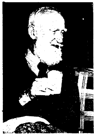
G. B. SHAW.

De wereldberoemde G. B. Shaw, die eeuwig van zich afbijt, heeft ook Hollywood niet gespaard. De artistieke en commerciële gemeenschap van de Kalifornische grootfabrieken mocht onlangs uit een schrijven van Shaw aan den filmproducent Sam Goldwyn volgende liefdelijke vermenen: «Hollywood heeft evenveel talent voor het vertellen van een story, als een blind hondje voor het komponeren van een symfonie. Voorwaar, het oordeel van den genialen toneelschrijver is niet op geheimzinnige wijze geformuleerd, veeleer suggestief... Men kan het desnoeds kernachtige, beeldrijke taal noemen.