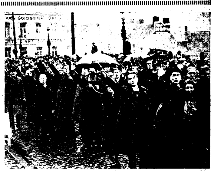
DE NIEUWE VADERLANDERS Dit is de Rex-bende, die zich bij den Onbekenden Soldaat, te Brussel, had opgesteld en zich zoo bijzonder onderscheidt door met onophoudend gebrul den voorbijtocht der IJersoldaten te storen en te misbruiken.