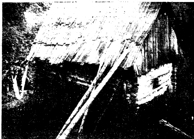
Een Ruthenische boerenisba

Dank zij de landbouwkundige die toezicht moet uitoefenen en wiens