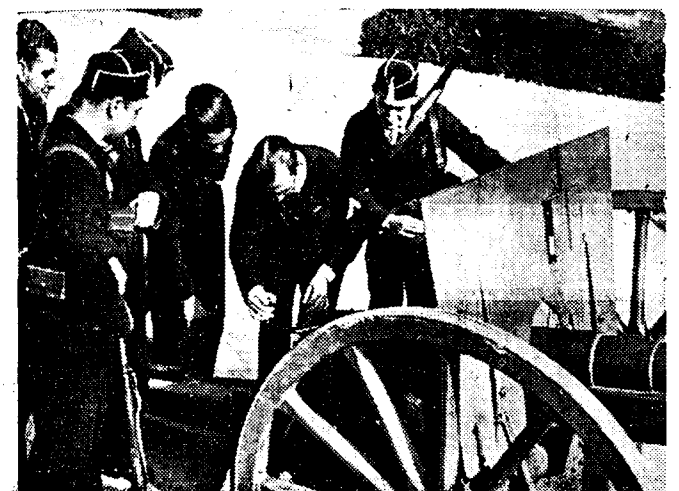
HET SPAANSCHE VOLKSLEGER In de militaire school van Barcelona, over de inrichting van welke we reeds schreven, worden thans ook militairen tot artillerie-officieren opgeleid.

In deze evolutie heeft de produktie der grondstoffen een belangrijke rol