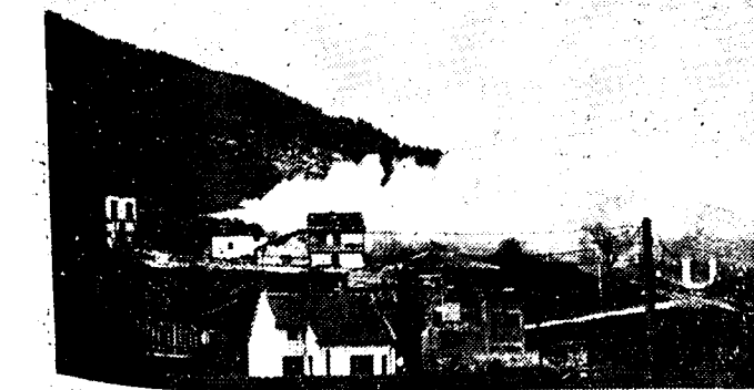
REGERINGSVLIETGIJVEN BOMBARDEEREN DUCHTIG De nieuwe bombardementstoestellen, door de regeering in dienst gebracht, werken duchtig aan het offensief mee. Bij een raid in de streek van Oviedo, gekluten twee der regeeringsvliegtuigen in een groot munitionedepot der rebellen in brand te steken.

Volgens mededeelingen van de politie te Heiligelee heeft niemand het ongeluk bij den overweg zien gebeuren. De auto moet echter met een zeer kalmen gang hebben gereden, doch het weer was slecht en de weg glad, waarbij dan nog komt, dat het uitzicht ter plaatse zeer slecht is. De bestuurder van den auto zal den trein dan ook wel in het geheel niet hebben bemerkt.