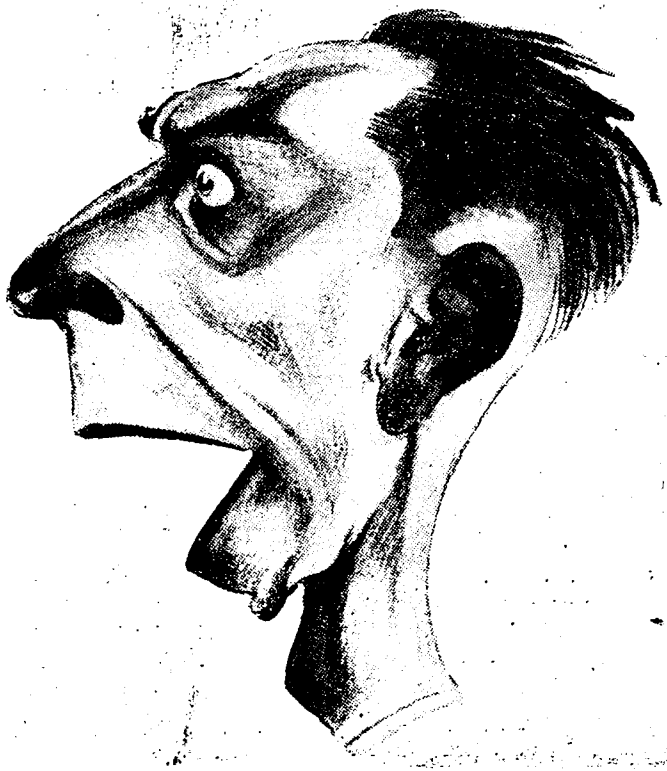
DE AAF GOEBBELS

« Wat Göbbels verblijft te Athene betreft, geven wij graag toe dat de Duitse propaganda-minister er in de maand September vertoefd heeft. Doch Degrelle vergeet (!) over pre-