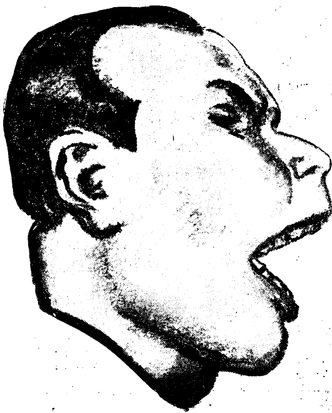
HET APENJONG DEGRELLE

Na deze staaltjes van volksbedriegerij en gewetenloze leugen-mentaliteit, stelt zich toch de vraag of er nog eerlijke menschen kunnen gevonden worden om nog het minste vertrouwen te stellen in den rex-avonturier, die niet alleen de vergiftiging van de openbare opinie in het binnenland op het geweten heeft, maar, wie weet, België nog door gekonkel in het buitenland in gevaar heeft gebracht.