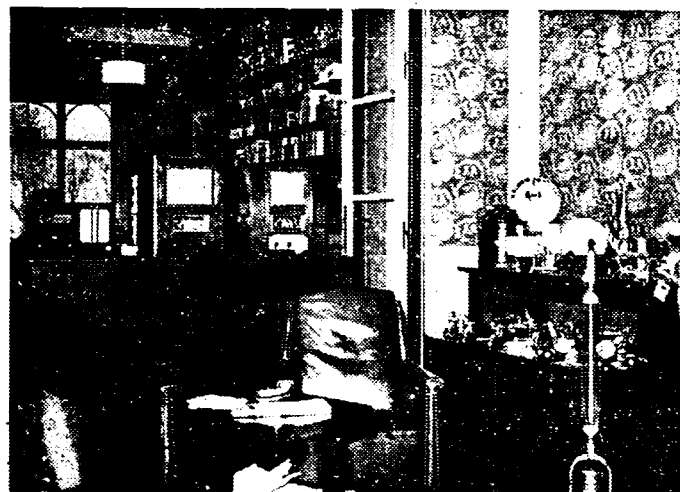
EEN KIEKIE VAN DE NIEUWE LOKALEN VAN DE RESEF over de opening van de nieuwe lokale van de Resef hebben uitgebracht.

De vet-betaalde Hitler-knechten van Rex en V.N.V. moeten worden weggevaagd. LOS VAN BERLIJN! VOOR DE EENHEID VAN BELGIË! VOOR WELVAART! VOOR VRIJHEID!