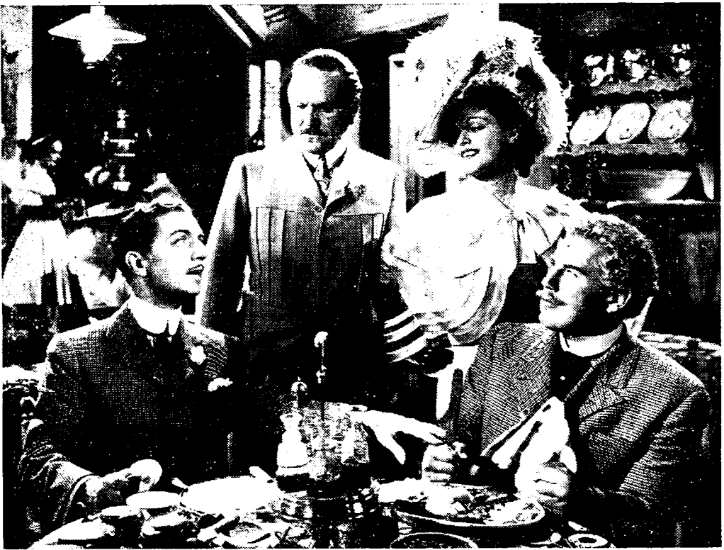
William Powell (rechts) in de titelrol van «De groote Ziegfeld»