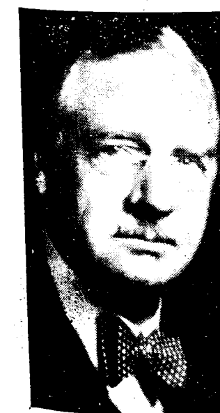
NOBELPRIJS VOOR GENEESKUNDE

Overall is de indruk gunstig... uitgenomen te Berlijn