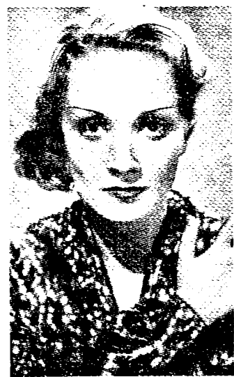
De jongste foto van MARLENE DIETRICH

De raadselachtige Dietrich? Een werking van licht en schaduw.