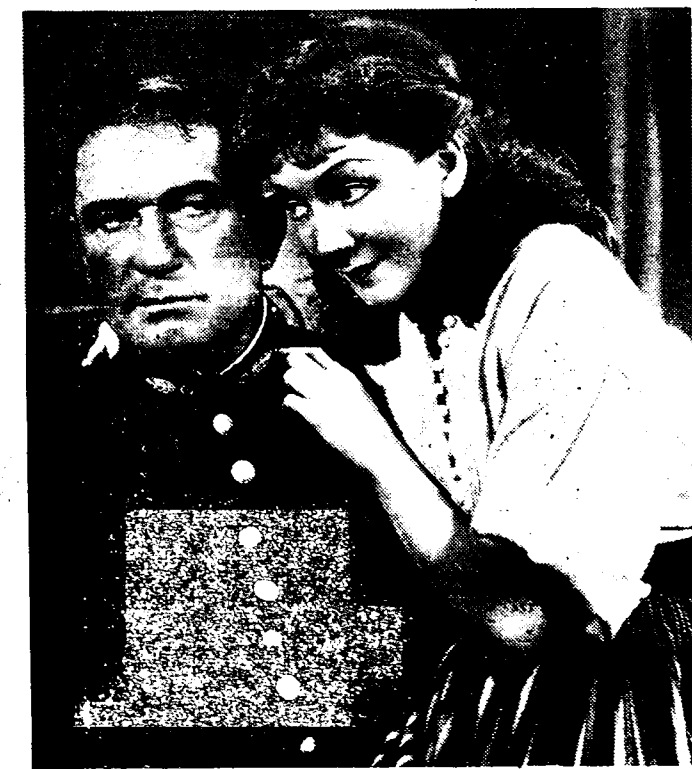
Clauette Colbert en Victor Mac Laglan in «Onder twee vlaggen»

Ziegfeld ontdekte de thans befaamde film-vedetten Eddie Cantor, W. C. Fields en Will Rogers. De film is Ziegfeld's grootste vijand geweest, want zij heeft al zijn «sterren» weggekaapt. Nu wordt zijn nagedachtenis in een groote geromanceerde show-film vastgelegd.