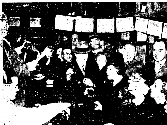
AMERIKANEN TE PARIJS

De Amerikaanse kolonie van Parijs, viert in een bekende bar in het centrum der Fransche hoofdstad, waar gewoonlijk de niet-drooge Amerikanen saamkomen, op feestdrijftige wijze de verkiezing van president Roosevelt.