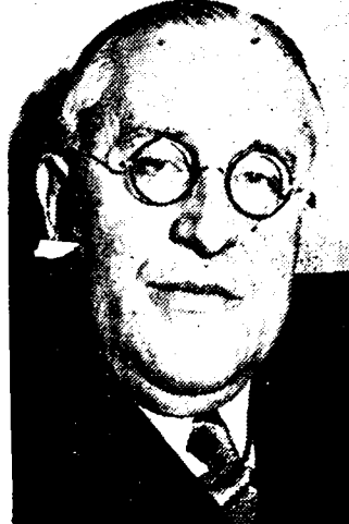
Dr. V. HESS De Oostenrijksche geleerde wien den Nobelprijs voor 1936 voor natuurkunde werd toegekend in verdeling met Dr. Anderson.

In hetzelfde nummer lezen wij dan hoe de Fransche kommunisten «een Duitschland ophitsen. Maar zouden de «Standaard»-lezers werkelijk zoo kort van geheugen en van geest zijn, dat zij niet weten hoe sedert jaar en dag alle ophitsingen en uitdagingen, die den vrede in Europa bedreigen,