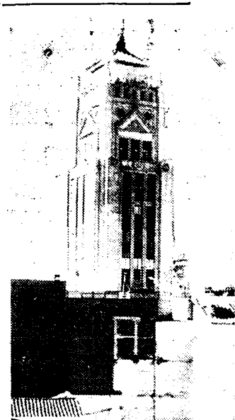
MADRID'S RADIO-TOREN Een kiekje van de radio-toren te Madrid, waar de officiële uitzendingspost der regering gevestigd is.

Zijn geel droeg talrijke lidteekens, en zijn been was helemaal verbonden. Hij had mij verteld dat zijn moeder werd gedood den eersten dag van de octoberomwenteling van 1934.