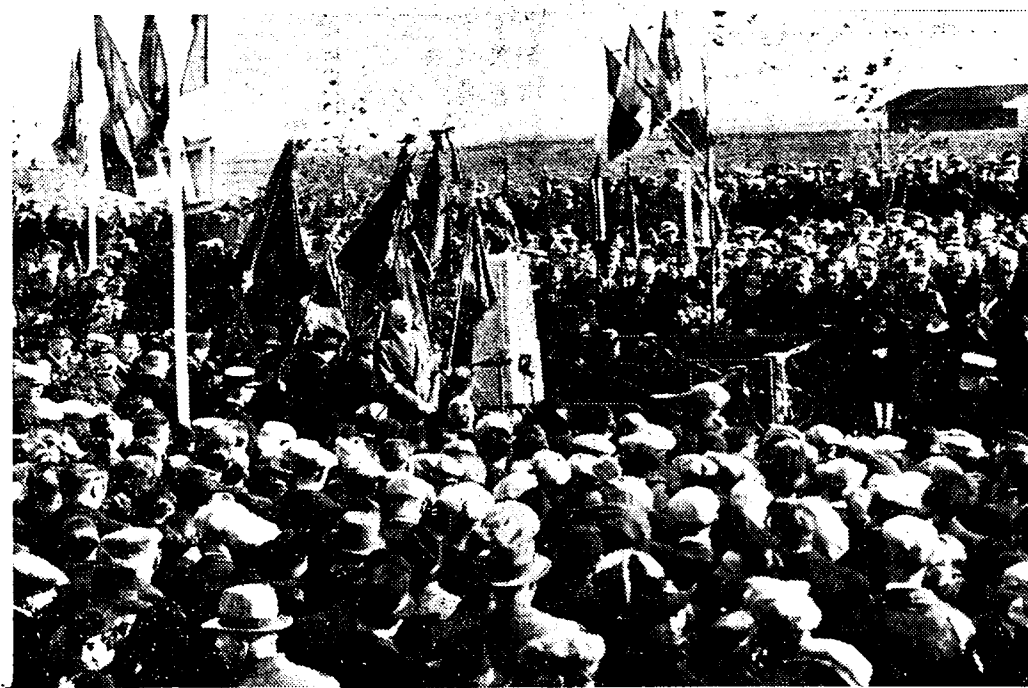
Bij de Fransche stad Soissons werd Zondag een gedenksteen opgericht tot gedachtenis van Jean Jaures en zijn zoon, die op deze plaats gedurende de gevechten van Chaudun in den grooten oorlog sneuvelde. Onze foto brengt de plechtigheid in beeld, op het oogenblik, dat Leon Blum (dien we naast het gedenksteen zien) een redevoering uitsprak.