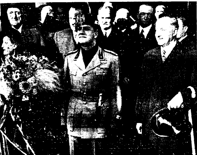
HET POLITIEK «TOURNEE» VAN GRAAF CIANO De politieke omreis van graaf Ciano door Europa ontdukt zich naar het plan door Mussolini uitgedacht. Thans voert de afgevaardigde van den Duce besprekingen te Budapest en men spreekt reeds van zijn toekomstig bezoek aan Londen... Onze foto toont de aankomst van graaf Ciano te Budapest waar hij ontvangen werd door den h. Daranyi, eerste-minister en den h. Kanya, minister van Buitenlandse Zaken.

De zaak zal op 5 December e.k. opgeroepen worden.