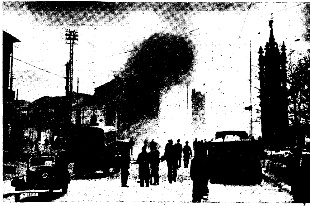
HET BOMBARDEMENT VAN MADRID

Hoe de huizen in een der voorname wijken van Madrid er uitzien, als de bommenwerpers van Franco — lees de vliegpostellen, die hem door Italië en Duitsland geleverd werden — er over gekomen zijn.