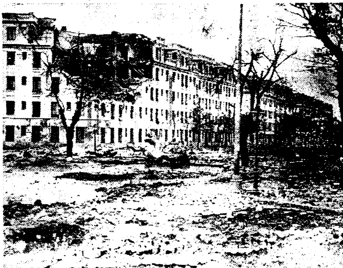
MADRID'S VERNIELING Nog een verschrikkelijk uitzicht van een gedeelte der Spaansche hoofdstad, dat onder een nachtelijk bombardement verwoest werd.

Franco aast op het Spaansche goud, dat in de Banque de France berust