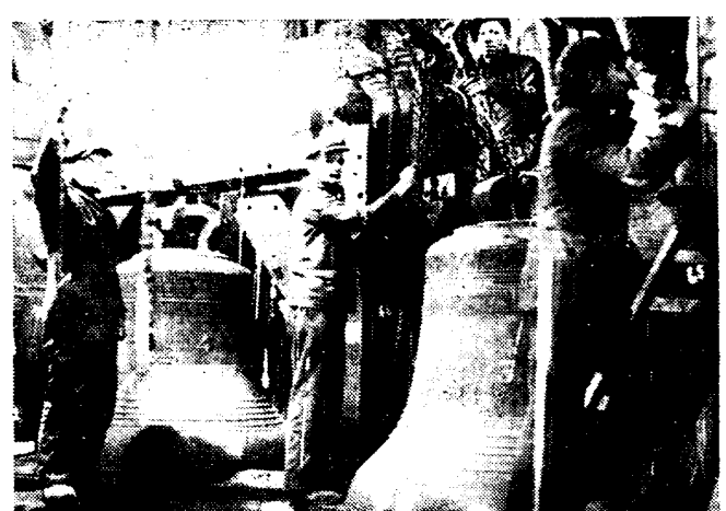
DE HERSTELLINGSWERKEN AAN HET BRUGSCHE KLOKKENSPEL Men is bezig den Brugschen beiaard te herstellen. Het is een reusachtig werk: 45 klokken moeten afgehaald worden (de grootste klok weegt 7000 kg.). Gevraagd de klokkenstoel wordt afgebroken en gansch vernieuwd in eikenhout. Het werk zal 4 maanden duren en gedurende heel dien tijd zal de Brugsche beiaard zwijgen over de oude stede.

Het meerendeel van de hervormde regeering van Nanking is naar Sjanghai gevlucht.