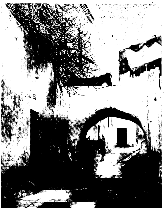
Een zicht van de Arabische wijk van de stad Sousse (Tunisië) welke door Daladier bezocht wordt.

Over de Engelsche pers, die zeer uitvoerig en in zeer sympathieken zin over de reis van Daladier schreef, zijn de Italiaansche bladen niet te spreken.