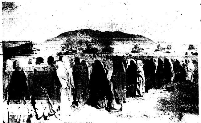
FRANKRIJKS MACHTSONTPLOOIING IN DE WOESTIJN VAN ZUID-TUNISIE. Tijdens zijn bezoek aan Zuid-Tunisië woonde minister-president Daladier het dejeuner bij van een modern uitgeruste en gemotoriseerde troepenmacht.