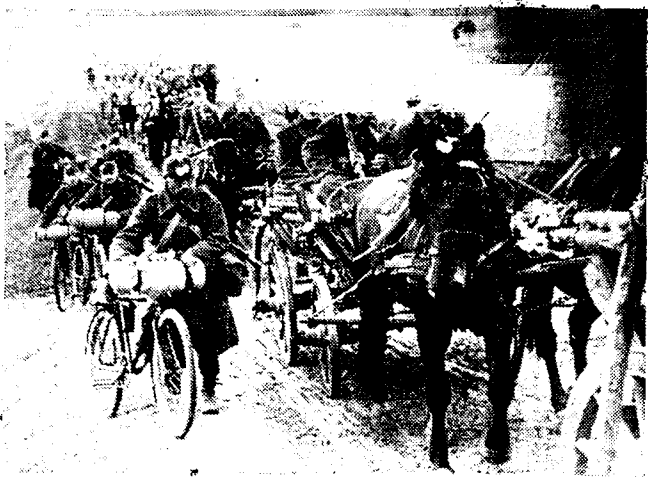
Hongaarsche troepen op weg naar de Tsjechoslowaaksche grens.

Nieuwe incidenten gemeld Praag en Warschau zouden militaire maatregelen getroffen hebben