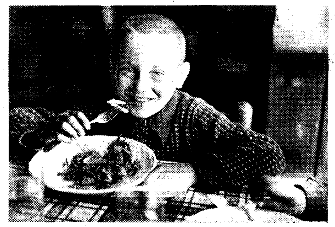
Een van de honderdduizenden op wier lichamelijke uitputting Franco spekuelt om het fascisme in Spanje te doen zegevieren.