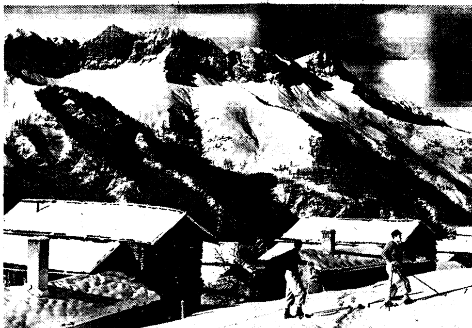
Een mooi zicht van het Alpendorp St-Véran, het hoogst gelegen van Europa, en dat daarom ook het centrum is geworden van de wintersport, indien men aan de manifestaties van het modern snobisme dien titel schenken mag.