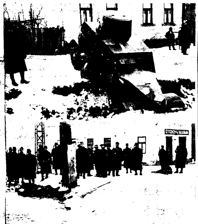
IN HET OOST-EUROPEESCH BUSKRUITVAT

Hierbij een paar beelden van de ernstige incidenten die zich voor enkele dagen tusschen Tsjecho's en Hongaren te Munkacs hebben voorgedaan. Boven: Een Tsjecho'sche pontonier die door de Hongaarsche artillerie buiten gebruik werd gesteld. Onder: De lijken van twee Hongaren, die tijdens de gevechten werden gedood, worden door Hongaarsche ambulanciers weggehaald.