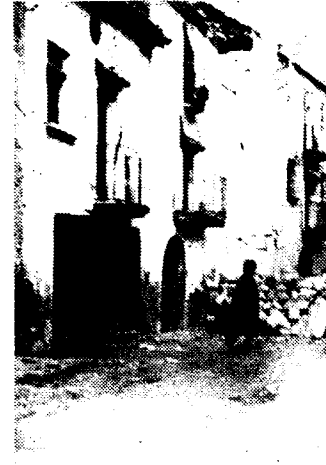
BIJ HET OFFENSIEF OP HET KATALAANSCH FRONT. In den straten van de gemeente Castellidans werden door de republikeinen versperringen opgeworpen om den opmarsch der rebellen te belemmeren.

De krachten in dienst van Franco hebben een belangrijke nederlaag geleden in de streek van Artesa de Segre, waar na een hevige artillerievoor-