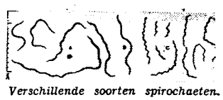
Verschillende soorten spirochaeten.

Achtereenvolgens en ons uitsluitend tot de pathologie die varieëten bij de mens behorende beschrijven Schaudinn en Hoffmann, de spirochaete van de syphilis reeds vroeger door twee groepen geleerden uit ons land, Bordet en Gengou, gezien. In 1911-12 wordt door Sergent en Nicolle de rol der vlooiën in het overplanten van de recurrenscourts beschreven. In 1914 ontdekte twee Japanse geneesheeren de spirochaete van de icterohemorrhagische courts. In 1919 legt een ander Japanse geleerde de rol vast van de leptospira icteroides in het ontstaan van de gele courts, en sindsdien werden nog talrijke andere spirochaeten in het bloed of in de lésels bij ziekten ontdekt, zonder dat het tot hertoe mogelijk was, hun rol als uitsluitend infectieus organisme met zekerheid te bepalen.