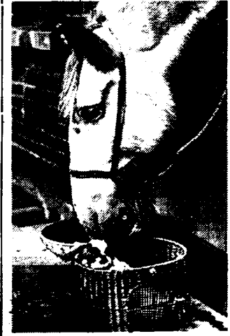
EEN VOORBEELD VOOR DE MENSCHENWERELD. Een typisch kiekje, dat de samenhoorigheid en de sociabiliteit bij de dieren illustreert. Het is waar, dat in menig geval de menschen op gebied van beschaving een voorbeeld kunnen nemen aan de dieren.