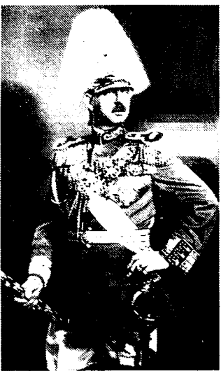
KONING CAROL VAN ROEMENIE.

Door IJzeren Garde beraamd Een bommen-laboratorium