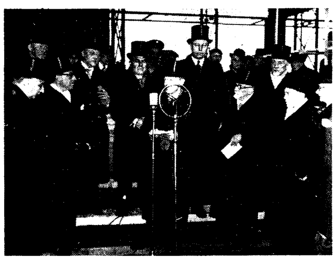
DE PLECHTIGE EERSTE-STEENLEGGING VAN HET LUXEMBURGSCHE PAVILJOEN TE LUK

De wettelijke zittingsperiode moet tenminste vijf maanden duren en dit betekent, dat nog voor het eindigen er van, de Kamers zullen moeten vergaderen tot de presidentsverkiezing. Men heeft zelfs reeds een datum aan, n.l. 6 April. Maar nog worden er geen kandidaten bij hun naam genoemd. Zou tenslotte Lebrun er niet voor te vinden zijn, zich eens te meer voor een nieuw termijn te laten benoemen? TH.