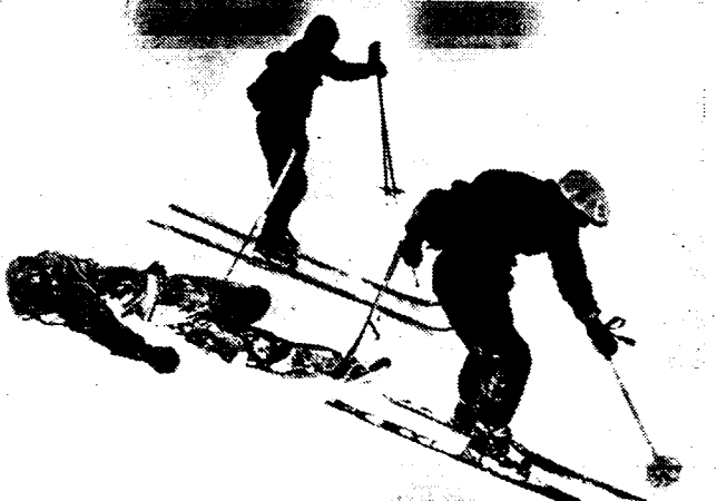
DE LAWINE-RAMP OP DEN GALIBIER. Het stoffelijk overschot van een der slachtoffers van de lawineramp op den Galibier, waar zooals wij hebben gemeld, zeven ski-loopers omkwamen, wordt door een reddingsploeg naar beneden gebracht.

Toen de politie zich echter aanmeldde in de woning van dr. Tanes, bleek deze reeds naar het buitenland te zijn gevlucht, al waar de jonge vrouw zich bij hem had moeten vervoegen.