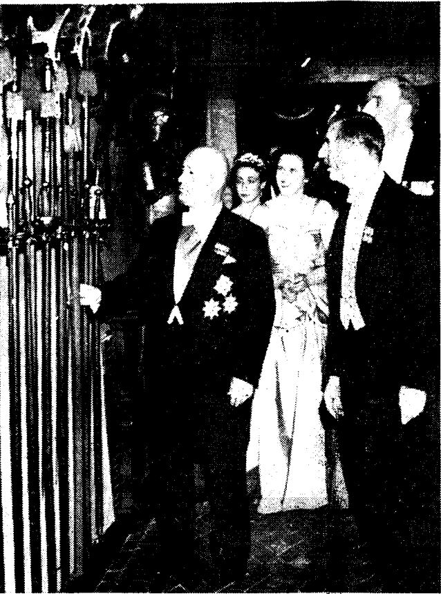
MUSSOLINI'S ZWAK VOOR WAPENGEKLEETTER. De Duce hield er aan Neville Chamberlain in het Venetiaanse paleis te Rome rond te leiden en hem in de «aal der gevechten» historische wapentrofeën te laten bewonderen.