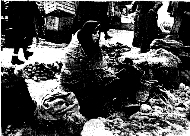
BIJ DEN WARBOEL IN OOST-EUROPA. Marktkiekie te Chust, de hoofdstad van Karpatisch Oekraïne, dat als uitgangspunt wordt georganiseerd voor den verdere Duitschen opmarsch naar het Oosten.